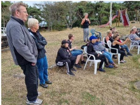
Läger Getterön 2022.

Bowlingläger den 3/12 i Bowlinghallen Varberg.