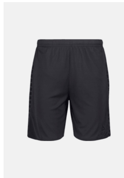
Teampris SELECT Argentina Shorts 199,- 159,-