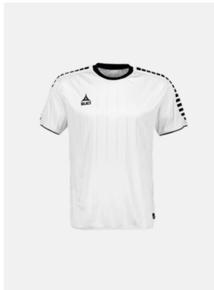
Teampris SELECT Argentina Ss Jsy 249,- 179,-