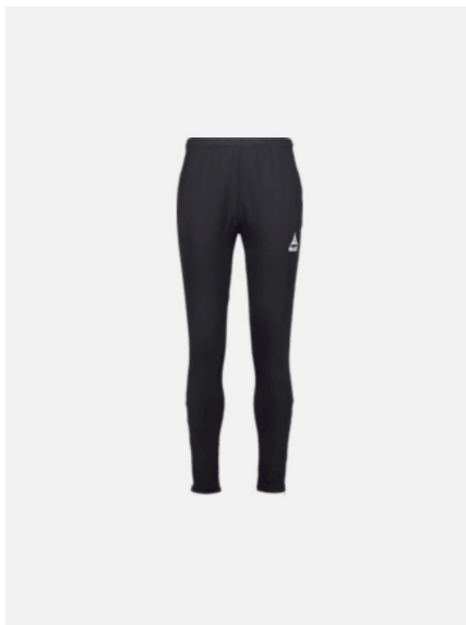
Teampris SELECT Argentina Pant 349,- 279,-