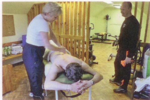
I den nyrenoverade hembygdsgården som Svensköps IF tagit över finns ett nytt gym – och möjligheter att bli masserad.

terna, men problemen i den lilla nordskånska klubben är av en helt annan karaktär.