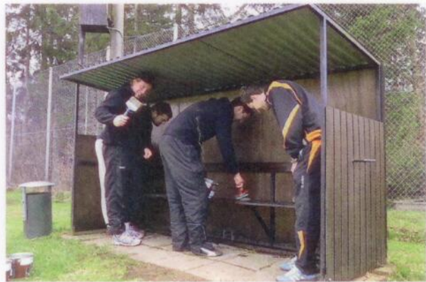
Med penslarna i högsta hugg tar killarna sig an avbytarbåset som ska bli fint till invigningen.