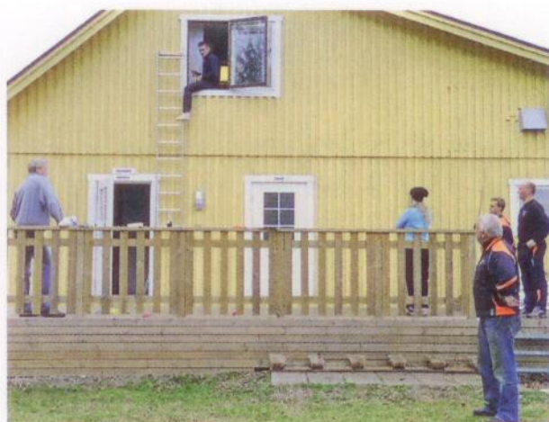
Brandsäkerhetsreglerna måste tas på allvar, även i en klubbstuga.

Ordförandet själv erkänner att han nog är lite av en eldsjäl, men vill ödmjukt lyfta upp något annat.