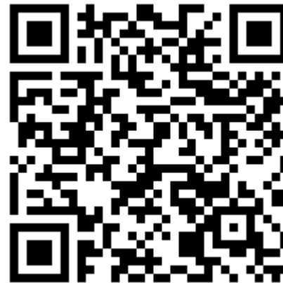
U13 (1 lag) Örebro/Västmanland