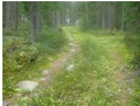
För att sedan övergå till skogsstig