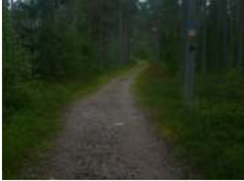
Första kilometern av banan går på elljusspåret