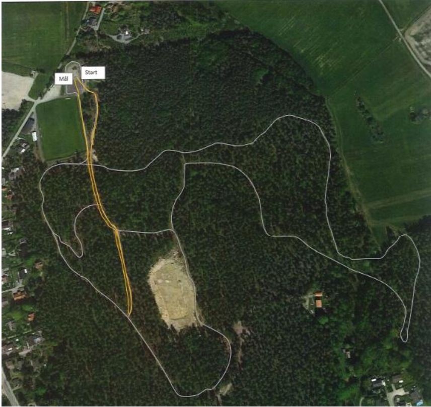
Banskiss 1,25 km