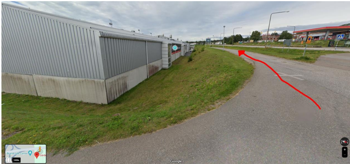
Ingång till frukosten.