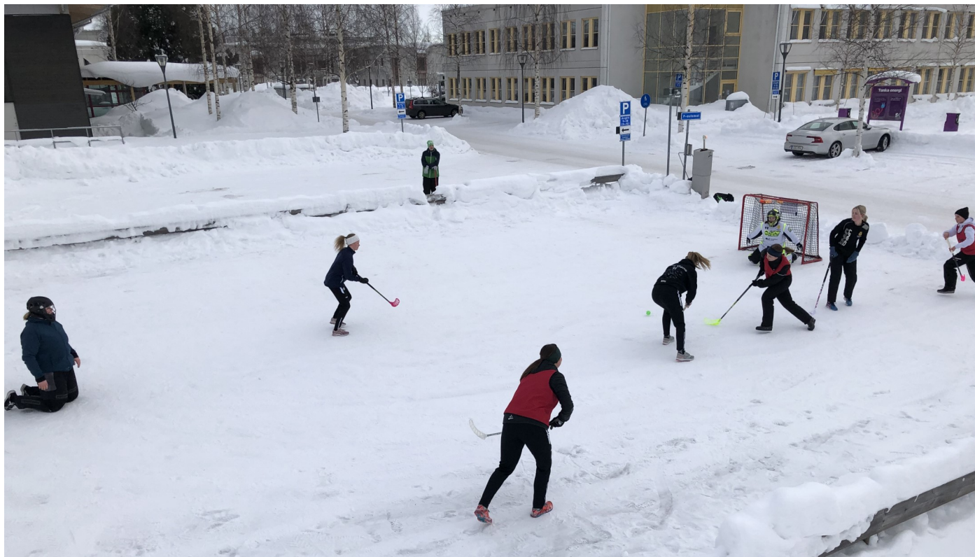
Match ett som spelades på Campus Close Court Stadium kunde till slut avgöras i sudden death efter en nagelbitare som slutade 7-7 efter full tid.

Lördag 13 februari spelades den historiska första slutspelsmatchen av Northern Floorball League av stapeln på Campus Close Court (CCC Stadium). Matchen som spelades i fyra perioder, hade flera skepnader.