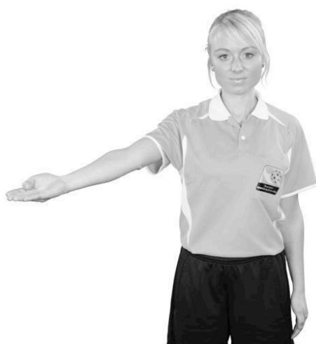
805 Fördel (armen i fördelsriktningen, handflatan snett uppåt in mot planen)