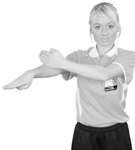
901 Otillåtet slag (ett slag med handen)