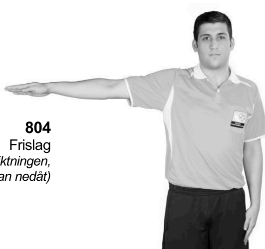
804 Frislag (armen vågrätt i fördelsriktningen, handflatan nedåt)