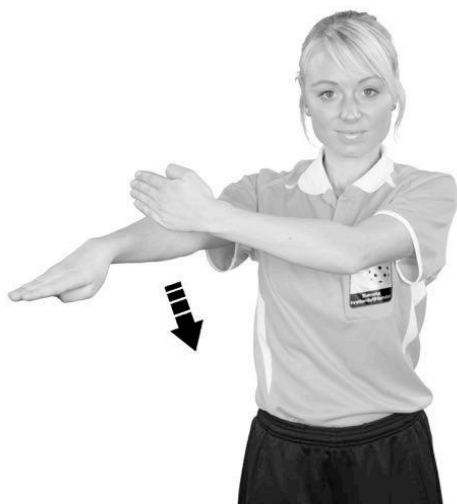
902 Låsning av klubba (handflatan nedåt)