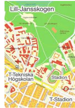
LILL-JANSSKOGEN / ÖIP