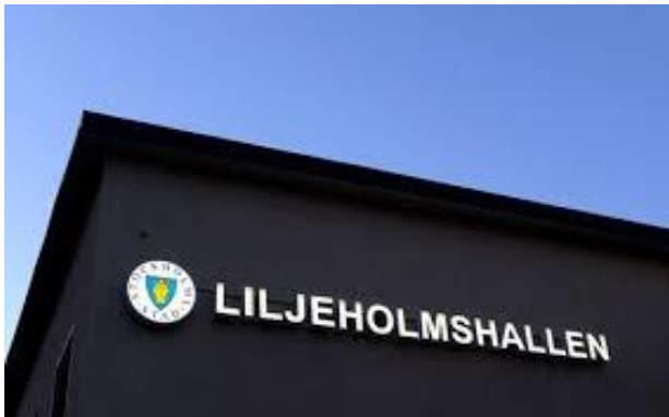
FUTSAL Sanktanserie P07-3