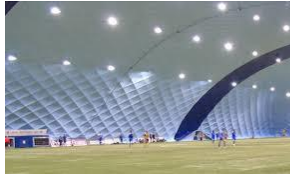
JB-HALLEN HJORTHAGENS IP - Torsdagar 1800 – 1930 ¼-del - Lördagar 1600 – 1730 ¼-del