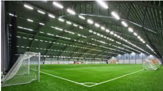
VINNARHALLEN BOSÖN/LIDINGÖ - Måndagar 1900 – 2030 ¼-del