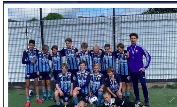
Vinnare i Ersanspokalen 2020! Titelförsvare i Ersanspokalen Träningsmatcher 9- och 11-manna