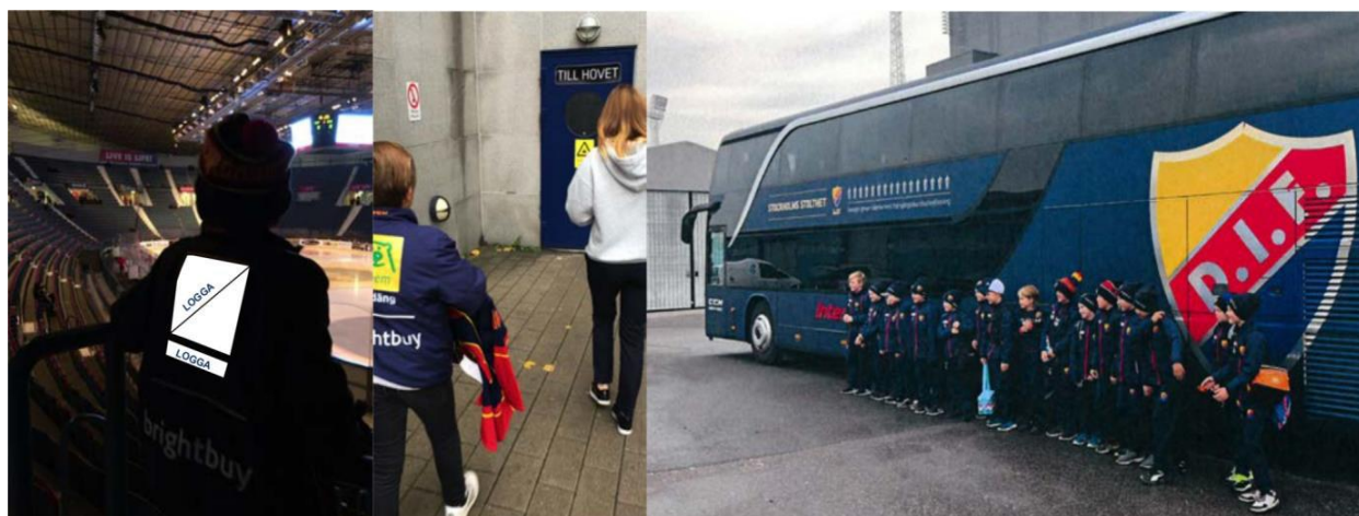
HOVET, PUBLIK SHL 5000-8000 PERS

Mälarhöjdens ishall har nära 8000 besökare varje år — och varje match filmas och läggs ut på svensk hockey.tv, vilket gör att er synlighet och impact blir ännu större. Våra ungdomar syns även frekvent på Hovet, iklädda sina overaller, när de säljer 50/50lotter under SHL:s matchen.