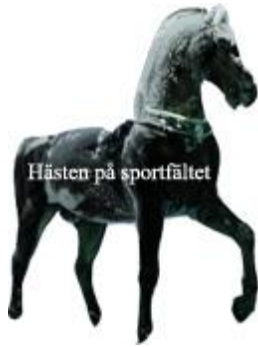
Hästen på sportfältet