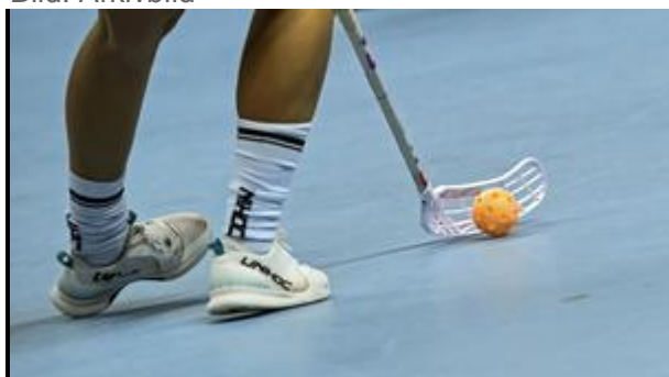
Västerås Idrottsallians prisade ungdomsledare inom innebandyn.