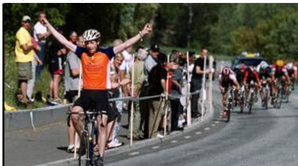
Västerås Idrottsallians prisade Västerås cykelklubb.