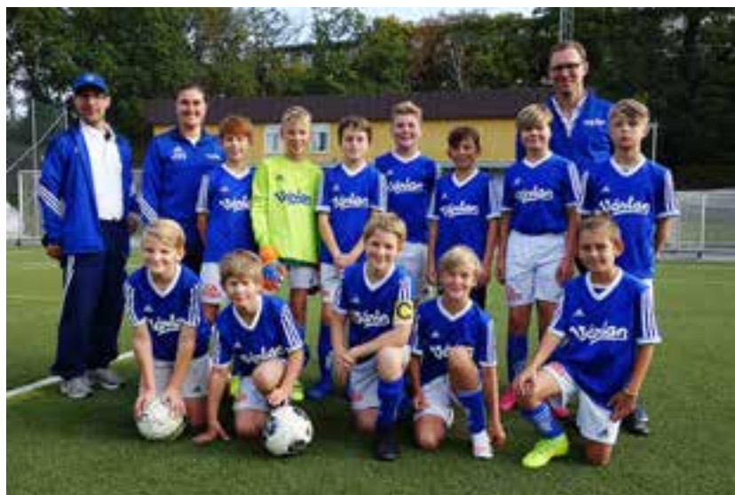
P09 Vit på Hjorthagens IP.