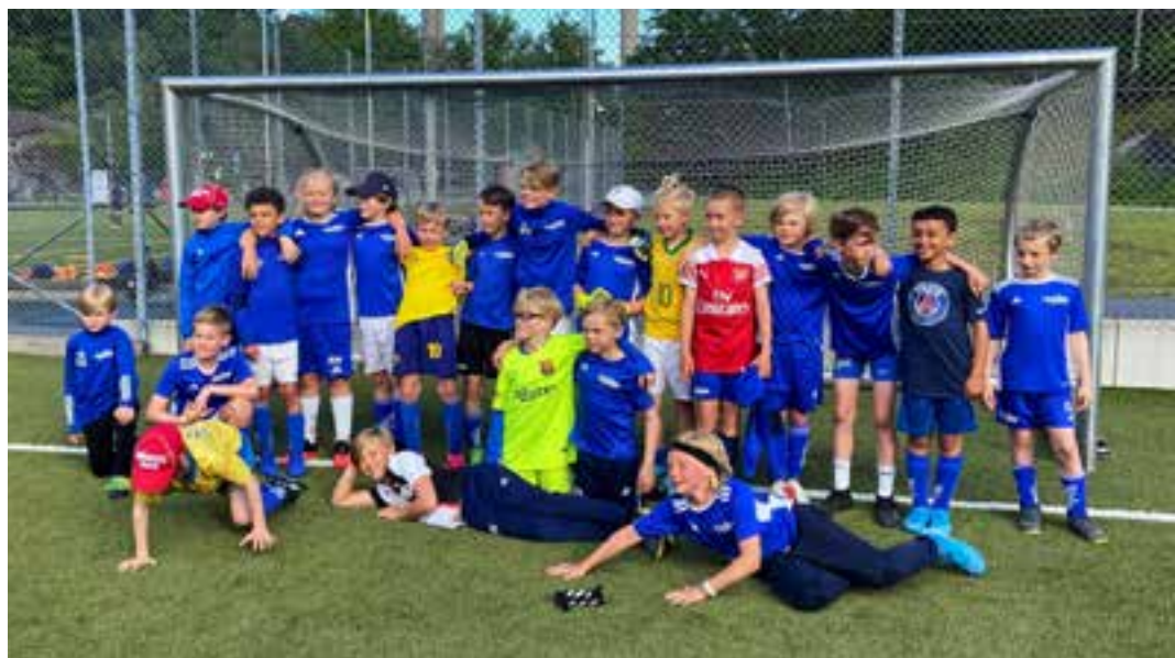
P10 på hemmaplan i Hjorthagen.