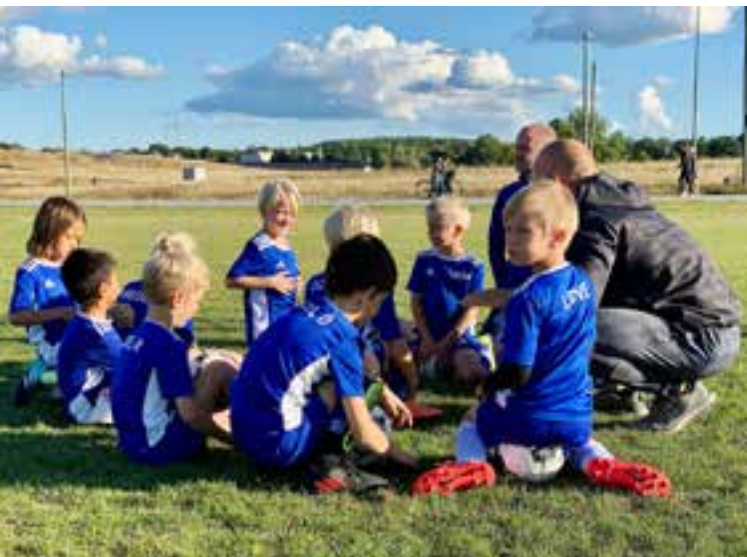
P13 Vit laddar på Gärdet.

Varje höst ordnar Ungdomssektionen Värtadagen , en heldag på Hjorthagens IP sponsrad av ICA Värtan, men i år satte coronan stopp. Så här såg det ut på fjolårets Värtadag. Hela 226 Värtaspelare mellan 5 och 13 år var med i tre olika turneringar och drygt 80 ungdomar, föräldrar och ledare var funktionärer.