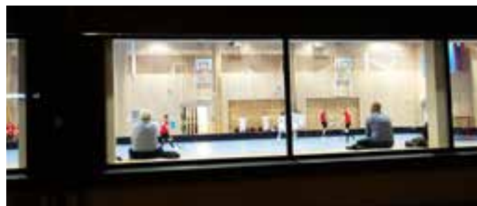
En fönstertitt på nya Hjorthagshallen.

Innebandy. Värtan innebandy är inne på sin 7:e säsong och spelar för andra året i nybyggda Hjorthagshallen. Förra årets säsong fick ett abrupt slut och avslutades i förtid med tre matcher kvar att spela. Värtan hade då tre poäng ner till strecket