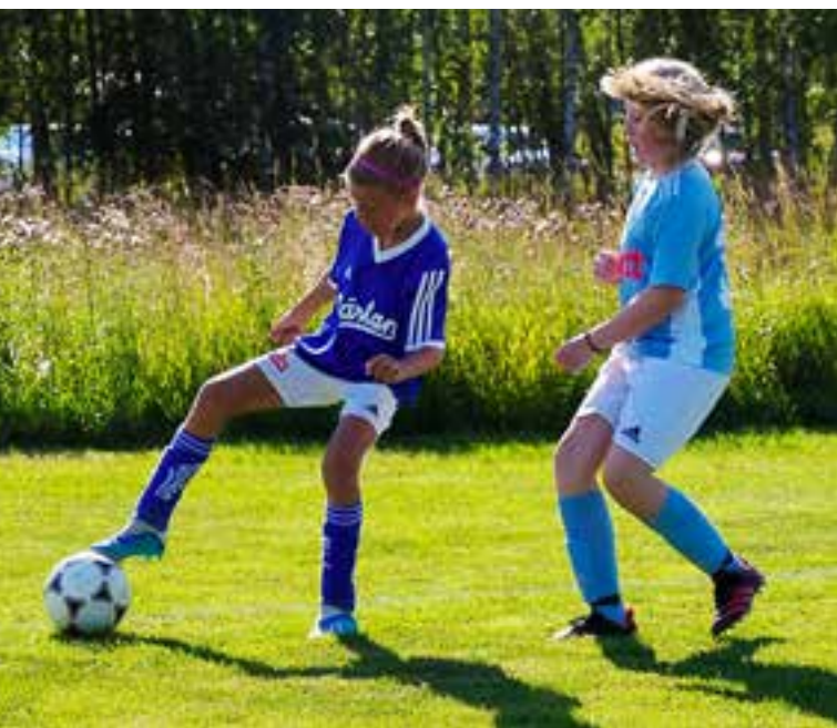
F09 möter Gideonsberg i Västerås.