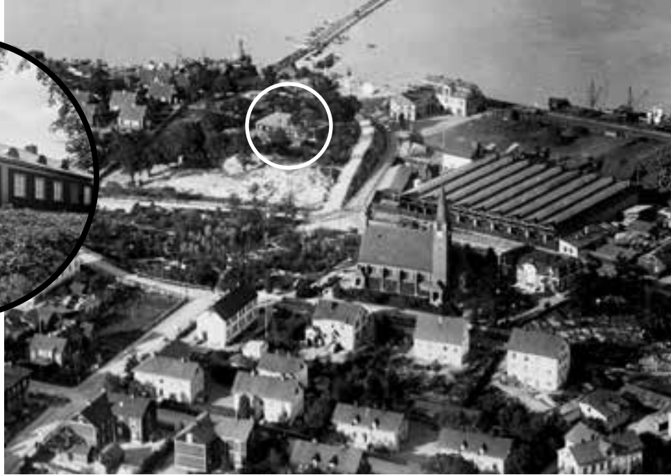
Cyanväteanstalten, officiellt Avlusningsanstalt Ropsten, var i drift 1919–45. Anstalten låg på en bergknalle och till höger anas spårvägsrälsen mot Ropsten. Den permanenta Lidingöbron (1925) är ännu inte påbörjad utan det är flottbron från 1884 som gäller.