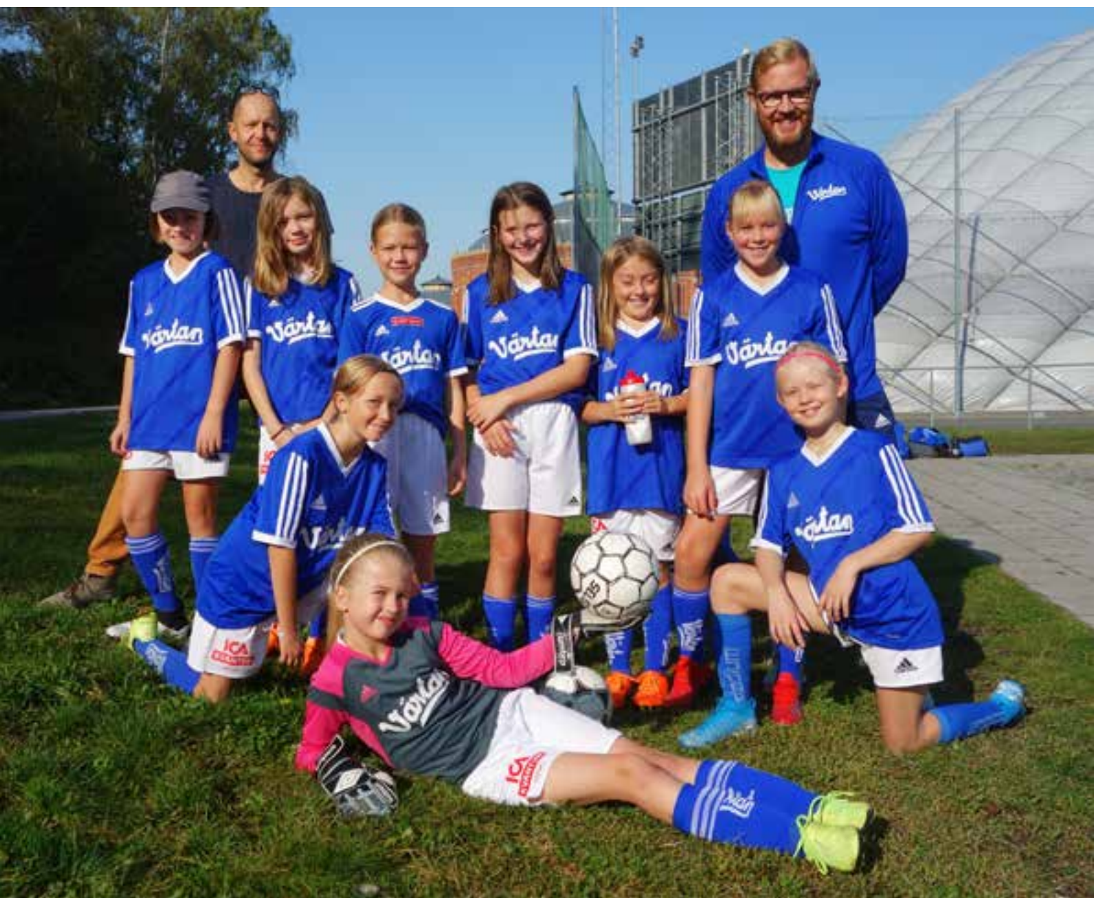
Värtans IK:s F10 Blå, ett av våra tjugosex ungdomslag i S:t Eriks-Cupen.