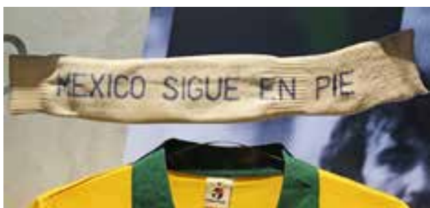
Strumpan som blev Socrates pannband: "Mexiko står fortfarande kvar".

När det blev nedröstat i parlamentet så flyttade mycket riktigt Socrates.