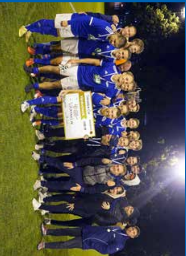
2019. Värtan (div 3)–Karlberg (div 2), 2–1 på Kristineberg.