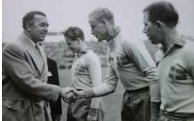
Jompa hälsar på prins Bertil inför matchen mot Finland 1951. Till vänster Gösta "Knivsta" Sandberg (DIF) och till höger Nils-Åke "Kajan" Sandell (Malmö FF).

1954 19 sept. Norge–Sverige 1–1 (ett mål) Oslo, publik 35 000. DN: Jompa »ytterligt effektiv och arbetsvillig«.