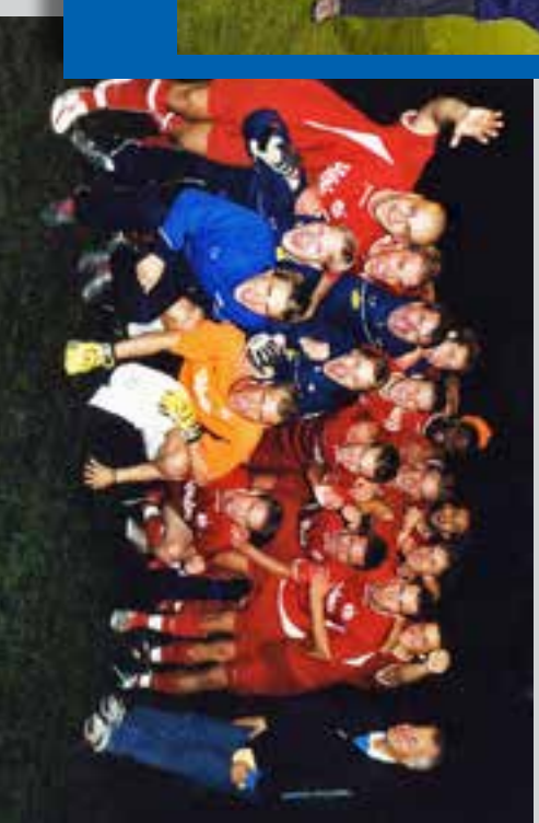
2004. Värtan (div 3)–Segeltorp (div 4), 4–2 på Skytteholm.