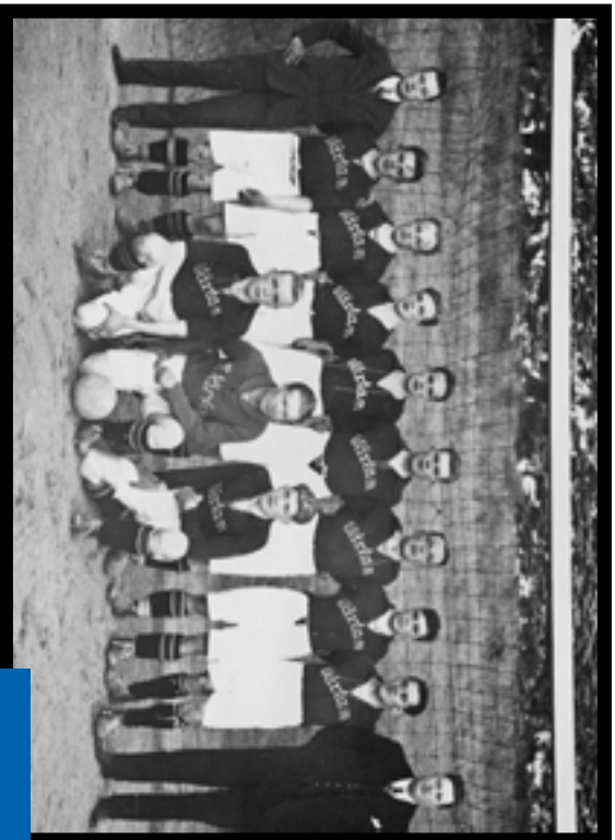
1930. Värtan–Lidingö, 3–2 (Lilla DM) på Råsunda.

1977 ersattes DM av Stockholm Cup. En raffinerad cupform, med en bonusstraff per serie, som skiljer lagen åt. Segraren får 40 000 kr. I årets final fick Värtan inleda med en straff mot Karlberg. Det var tredje gången som Värtan gick till final (1997, 2004 och 2019) och varje gång har Värtan stått som segrare.