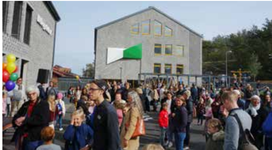
Bobergsskolans två nybyggda hus.

Hjorthagens stenskola används under den närmaste framtiden för Hedvig Eleonoras elever, då deras skola renoveras.