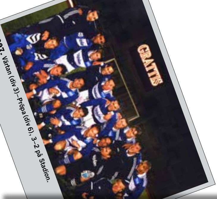
1997. Värtan (div 3)–Pröba (div 6), 3–2 på Stadion.