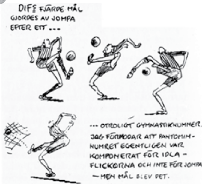
Kommentar efter en match mot IFK Norrköping 1958.

publik 35 000. Sverige tämligen chanslöst tidigt på säsongen. Detta blev Jompas sista landskamp, efter sju raka matcher som center.