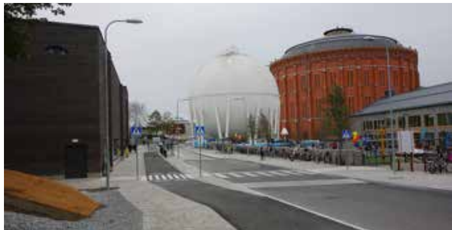
Hjorthagshallen till vänster, Bobergsskolan till höger.

De stora fönstren mot gatan skapar en utmärkt ståplatsläktare. Dock något sval emellanåt.