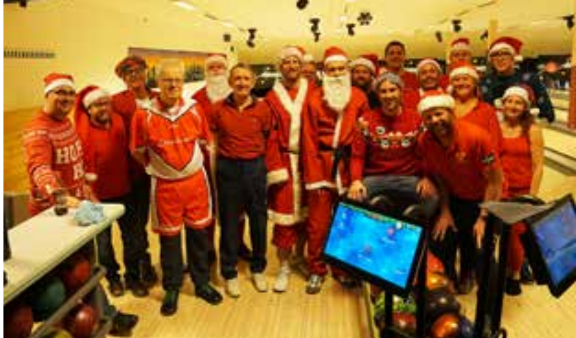
Värtans bowlare hälsar God jul. Julslagningen, sista träningskvällen före jul 2018.

Efter vinst i div 2 Östra Svealand i våras tog Värtans A-lag i bowling steget upp i div 1 Södra Svealand. En tuff serie med respekterade klubbar som Amiki, Djurgården och Hammarby. Längre resor blir det förstås också, bland annat till Norrköping, Linköping, Eskilstuna, Strängnäs, Katrineholm och Västervik.