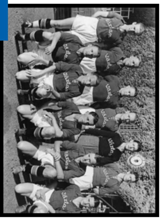
1940. Värtan och IFK Lidingö möttes fyra gånger och Värtan vann till sist efter tre oavgjorda matcher. Sammanlagt sågs matcherna på Stockholms Stadion av 8500 åskådare.

1977 ersattes DM av Stockholm Cup. En raffinerad cupform, med en bonusstraff per serie, som skiljer lagen åt. Segraren får 40 000 kr. I årets final fick Värtan inleda med en straff mot Karlberg. Det var tredje gången som Värtan gick till final (1997, 2004 och 2019) och varje gång har Värtan stått som segrare.