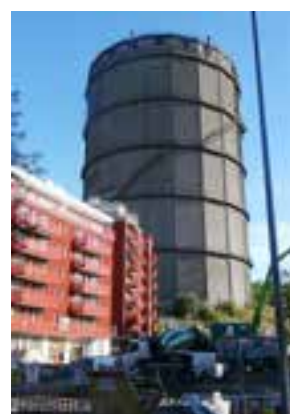
Kv Björnlandet och den nu rivna gasklockan.

Det röda svängda huset tillhör kvarteret Björnlandet i Norra Djurgårdsstaden. Något bakom till höger, syns den plats där den högsta gasklockan stod (revs våren 2018). Till höger om den vita globformade byggnaden (Gasklocka 5), ligger sporthallen med sitt gröna tak och bortom samma gasklocka byggs Bobergsskolan, som ska stå klar hösten 2019.