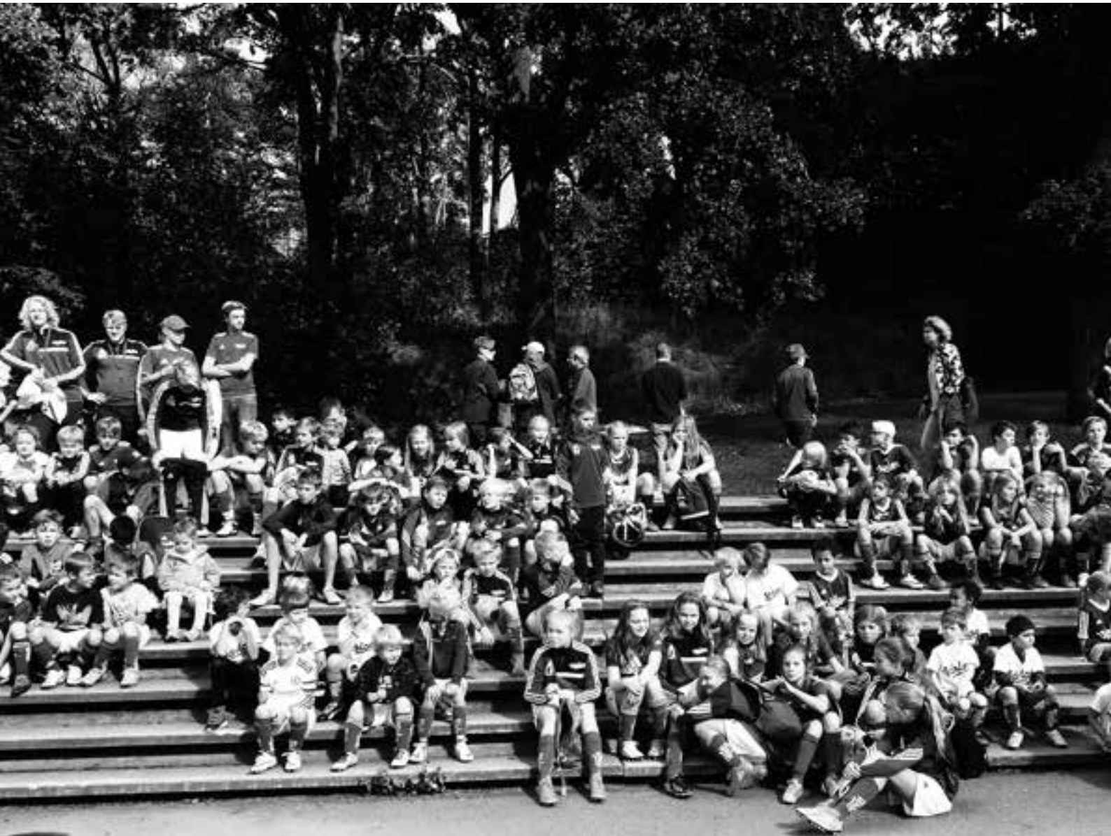
Samling på läktaren inför Värtandagen.