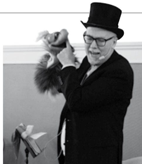
Max Magico i aktion på 2016 års plundring.

Klubbens officiella hemsida är www.vartanfotboll.se . På startsidan kan du bland annat välja »Föreningen«. Här hittar du Värta-bladet från 2012 och framåt.