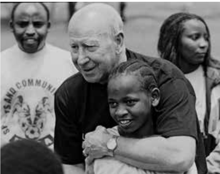
Bobby Charlton som idrottsambassadör i Kenya.