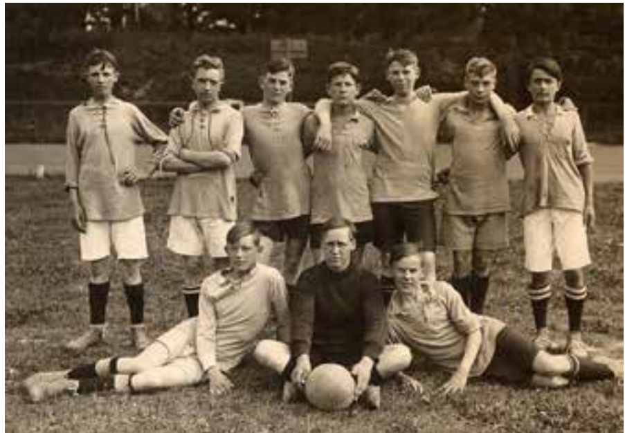
Värtans juniorlag 1914. Kanske den elfte spelaren höll i kameran?

Sportsligt blev slutet 1922 tjugusigt. Värtan nådde långt i Svenska Fotbollsmästerskapen som avgjordes i cup-form. I de förberedande omgångarna vann Värtan mot Råsunda, Sundbyberg, Uppsala IF och Sirius. I första slutomgången väntade bortamatch mot storfavoriten Sandvikens AIK. Matchen slutade 2-2 varför det blev omspel på Stadion. I