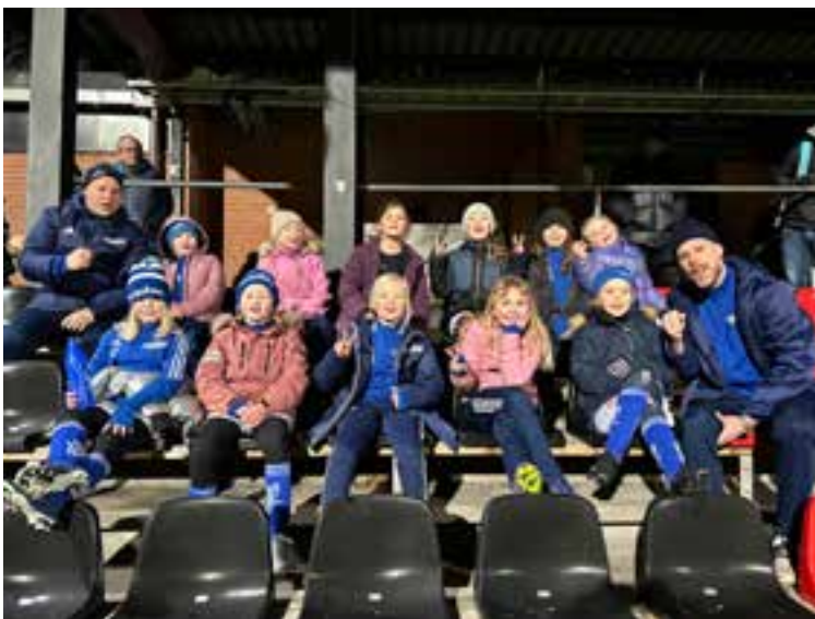
F14 på Grimsta