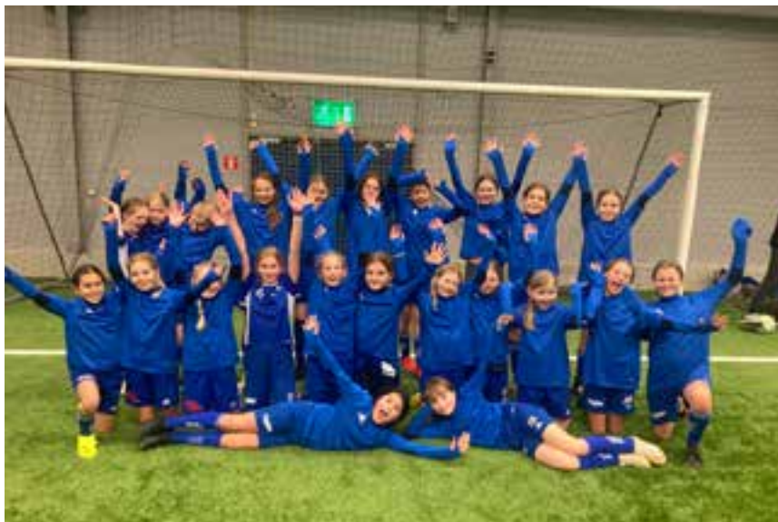
F 11 med nya träningströjor

Den största gruppen är F11 med hela 55 spelare. Olika grupper i denna jättetrupp har deltagit i olika event. Se bildtexterna.