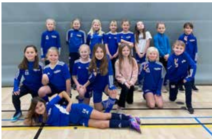
F14, alla sexton spelarna