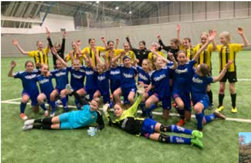
F11 på matchcamp på Åland. Bland annat vinst mot HJK Helsingfors