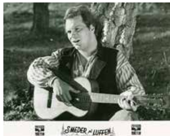
Sångaren Anders Börje förekom även i ett antal filmer. Här i ”Smeder på luffen” (1949)