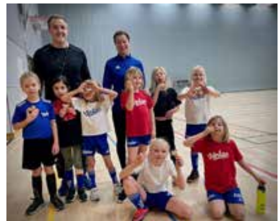
F15 vit med pepparkakor