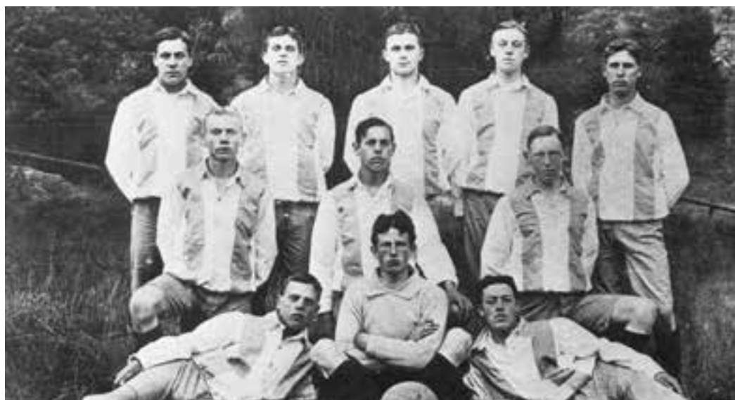
Värtans första fotbollslag 1911. Längst fram målvakten och backarna, därefter halvbackskedjan och längst bak forwardskedjan.

Klubben utvecklades förbluffande snabbt och framgångsrikt. Hemmamatcherna spelades på Östermalms IP (invid 1906) och den registrerade dräkten var blå tröja och vita benkläder (kort-