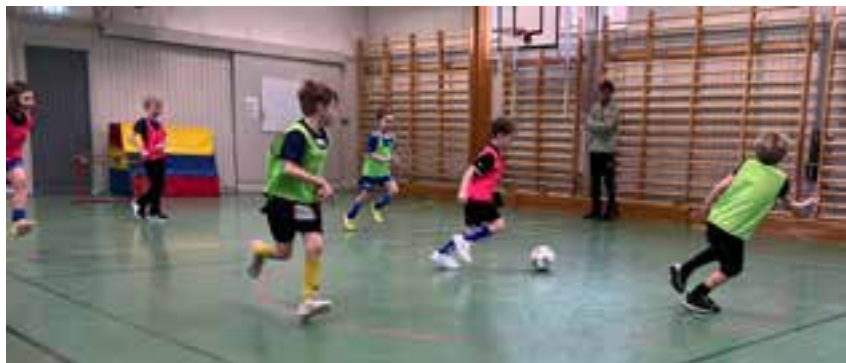
P15 röd Johannes skola.