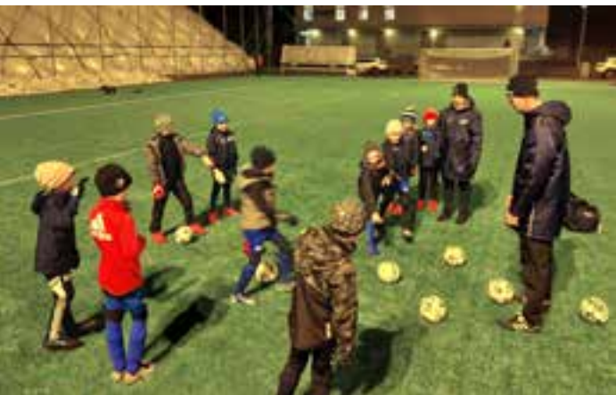
P14 blå på Hjorthagens IP