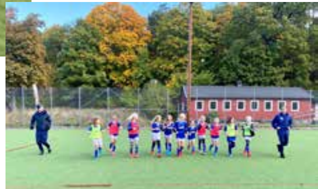
F13 på Ekhagen