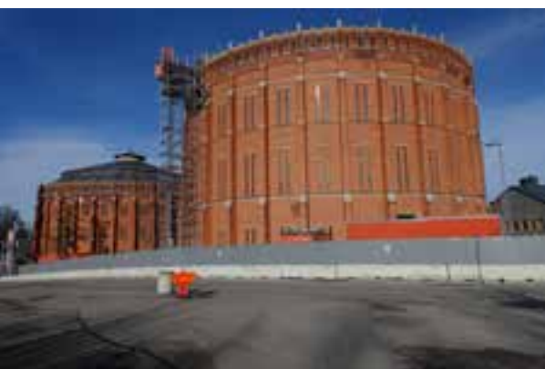
Tegelgasklockorna i mars 2023. Längst bort nr 1 (1893), i förgrunden nr 2 (1900) under renovering.

Omslagsbilden: Gasklocka nr 1 från 1893. Arkitekt Ferdinand Boberg. Teckning Edwin Håård.