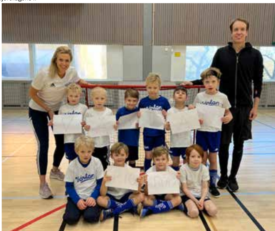
P16 Röd tränar på GIH