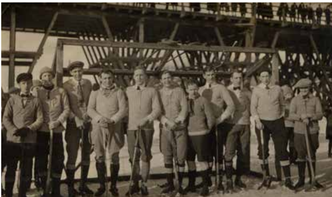
Värtans bandylag 1920, vid Hornstull. Målvakten i ylletröja och fotbollsknäskydd

I nästa nummer kan du bland annat läsa om hur en idrottsklubb som Värtan skaffade sig inkomster på den här tiden.