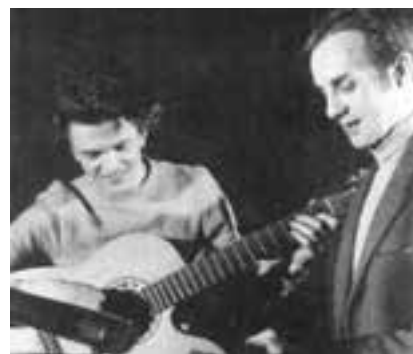
EPA och Jarl Kulle 1957. Grammofoninspelning av visor av Dan Andersson.