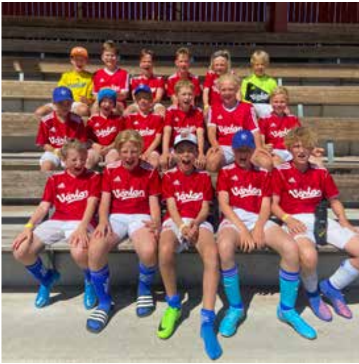
P 10 Falu sommarcup