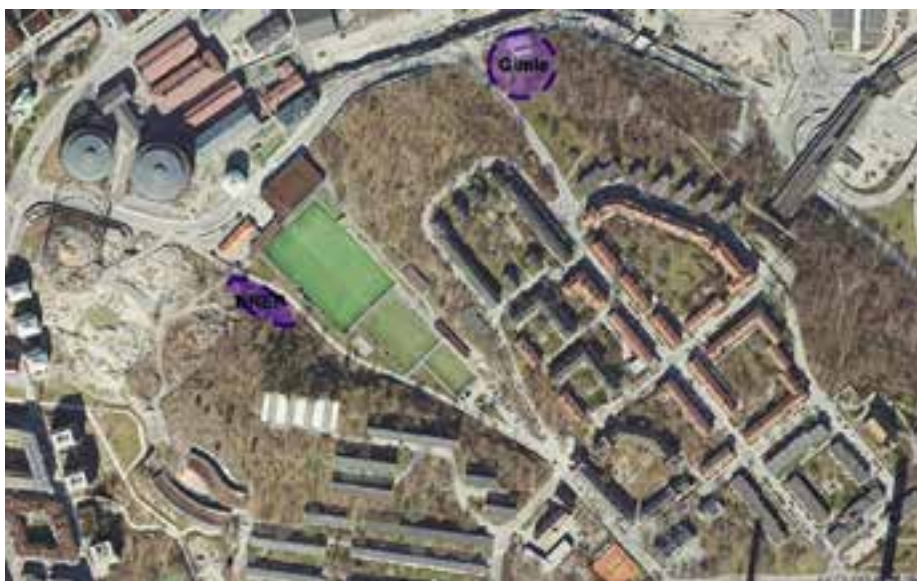
Stadens karta över de senaste markanvisningarna. Det bör betonas att flera kartversioner existerar, på vilka de tänkbara byggområdena är betydligt större.