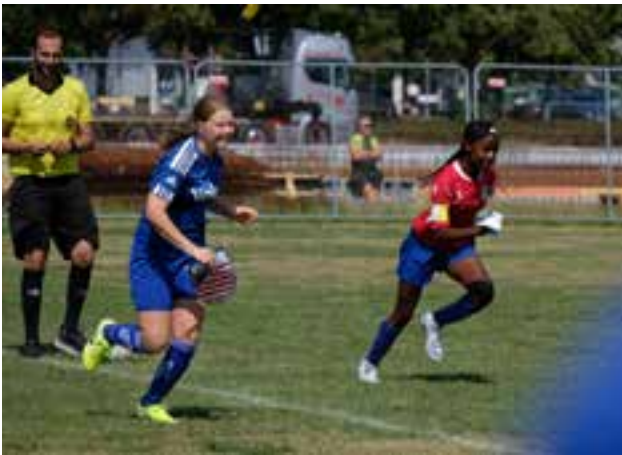
F-09 flaggbyte med FC New England i Gothia Cup