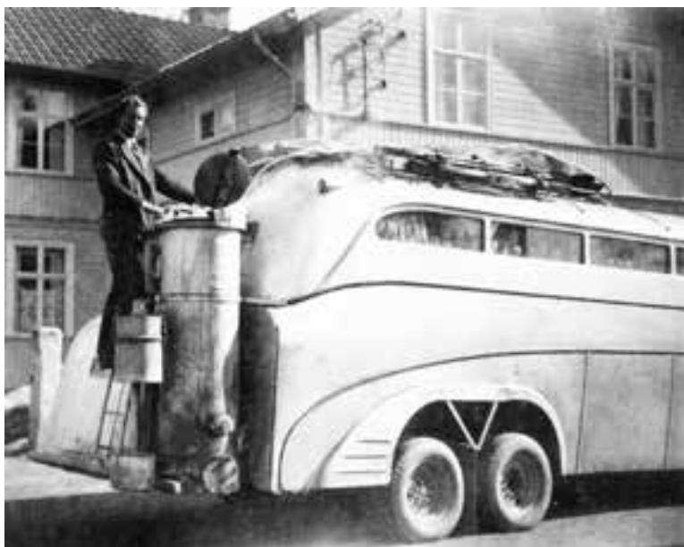
Gengas kunde sitta både bak (här på en buss) och fram (bilden överst på en personbil).