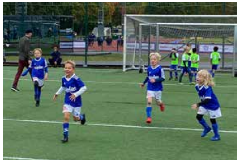
P 15 Blå målgädje