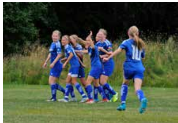
F-09 firar ett mål i kvartsfinalen i Gothia Cup