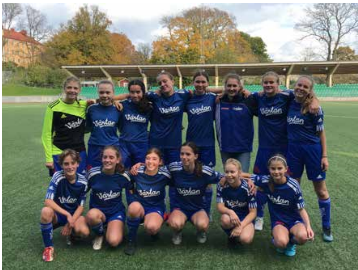
F07 (bilden tagen på Kanalplan, numera Hammarby IP)

Utrymmet i Värta-bladet är begränsat, så därför kan vi bara visa ett axplock av den stora verksamheten. Se även sid 7 och bilden på P05.