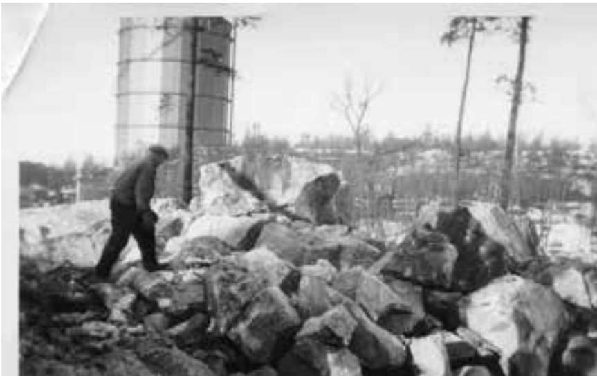
Här sprängs det på Lilla Jägarbacken. I bakgrunden kolonistugor där parkleken Hjortgläntan numera ligger.