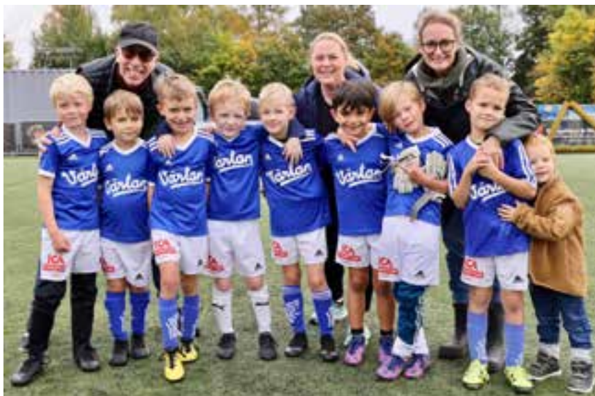
P 15 röd