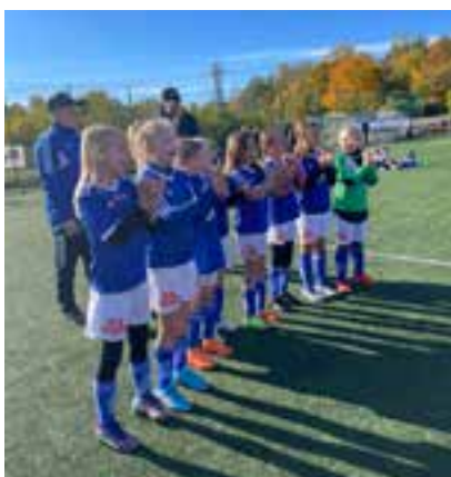
F 14 Vit