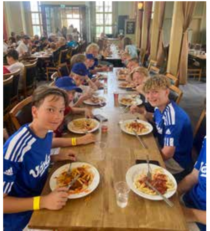
P 10 Falun