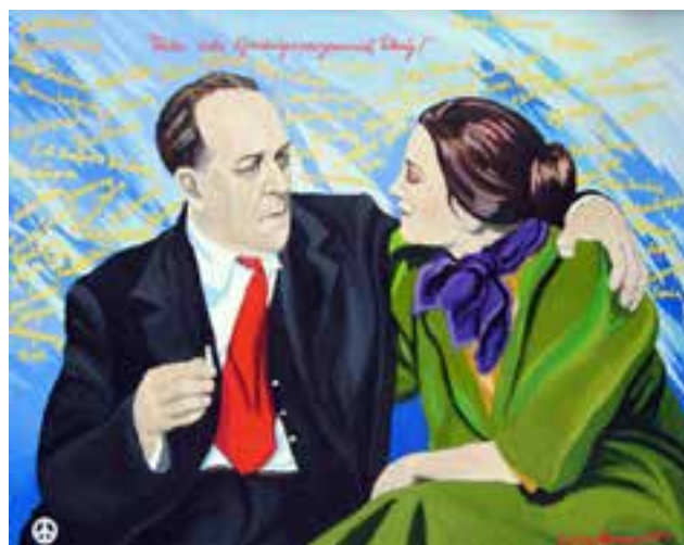
Pappa och jag