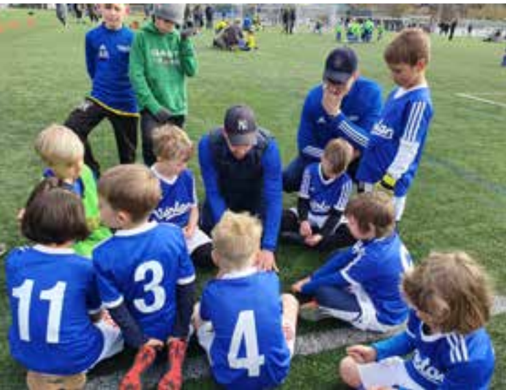
P 15 Blå