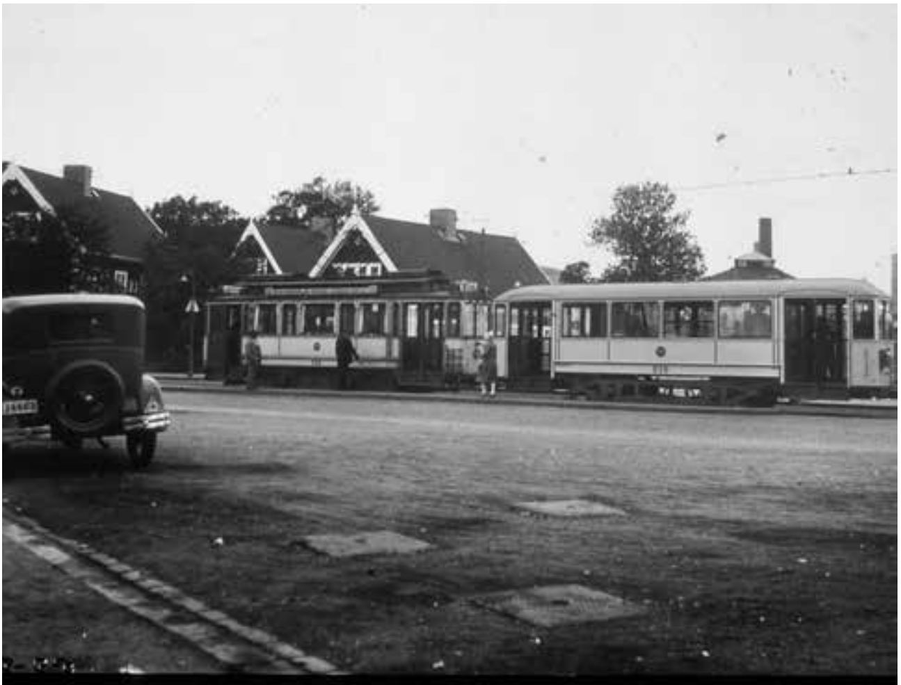
Spårvagn nr 10 nere i Ropsten