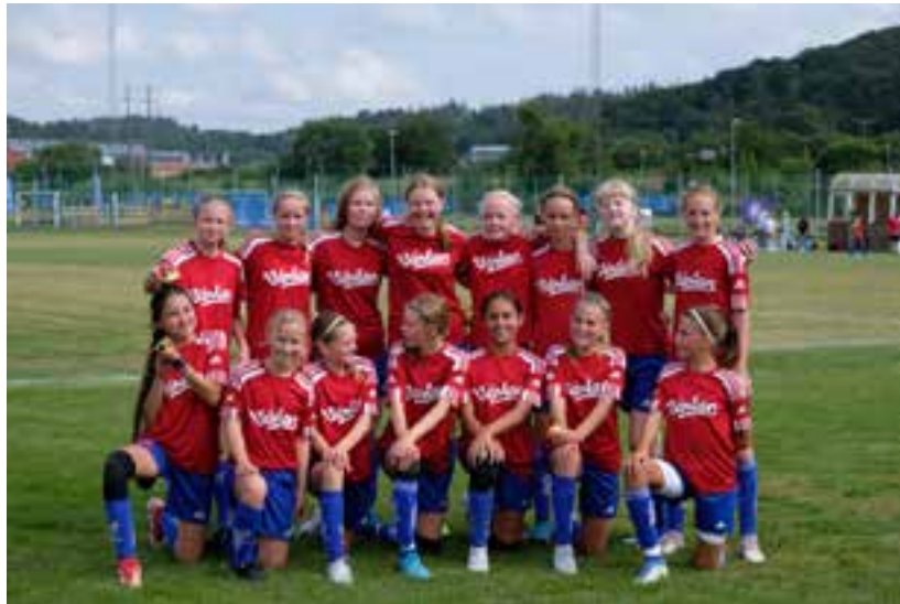
F-09 Gothia Cup i Göteborg