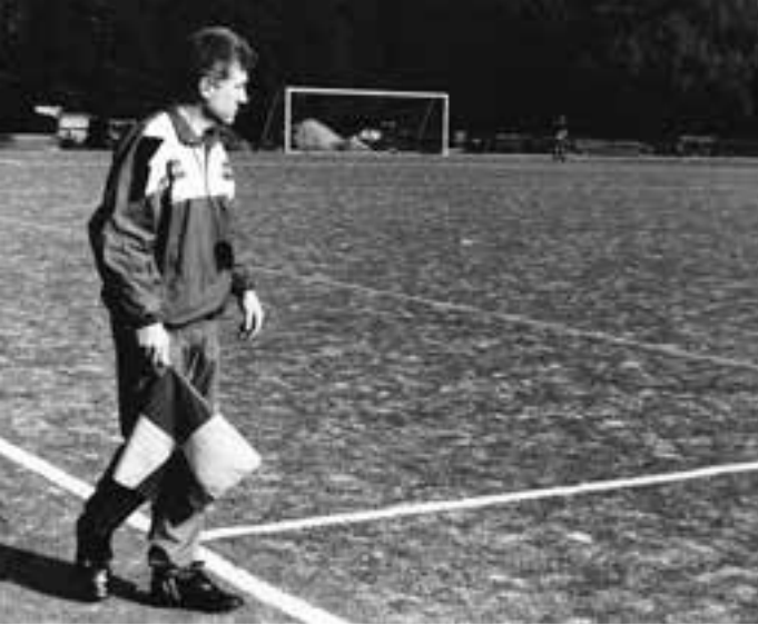
Lagledare i B-lag blir förstås linjeman.