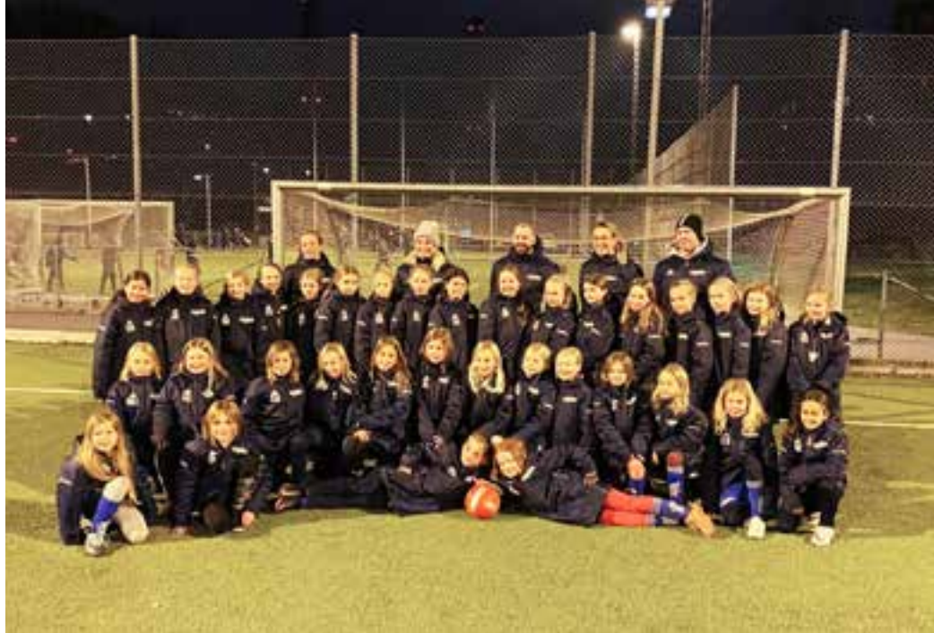
Värtans F11 år 2020.