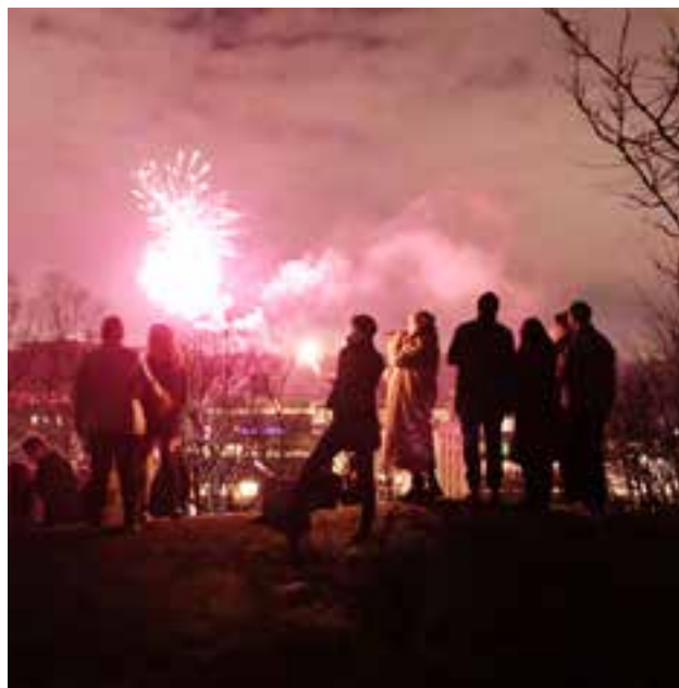
Coronasäkert nyårsfirande i Duschparken med utsikt över Norra Djurgårdsstaden.

Årsavgiften för en stödjande medlem är 250 kr för år 2021. Som medlem får du säkert Värta­bladet. Betala till Värtans IK plusgiro 259393-7 eller swish 123 602 35 84. Ange »ny medlem« och din postadress.