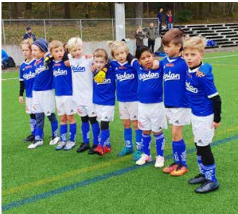
Första matchen för P13 i Oktoberbollen i höstas.