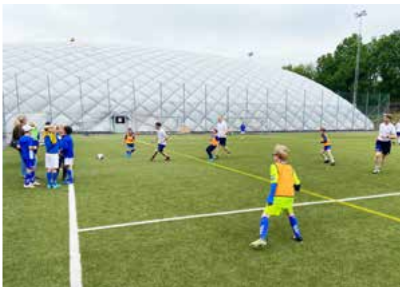
Så här ser det normalt ut när P10 tränar.