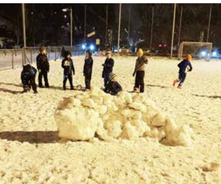
P13 blå byggde en frisparksmur.

Kolla på laget.se/VIK_A om programmet fortfarande är aktuellt.