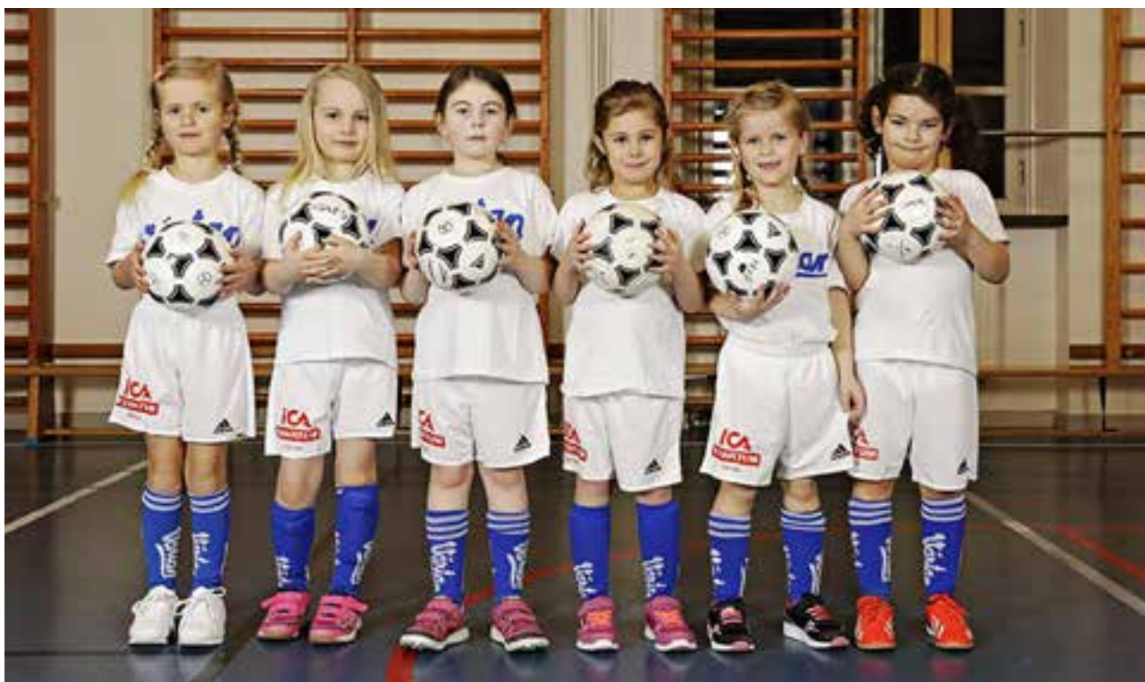
Värtans F11 år 2018.

Flickor födda 2011 , 43 stycken hos oss, är en av de största F11-kullarna i Stockholms fotbollsklubbar.