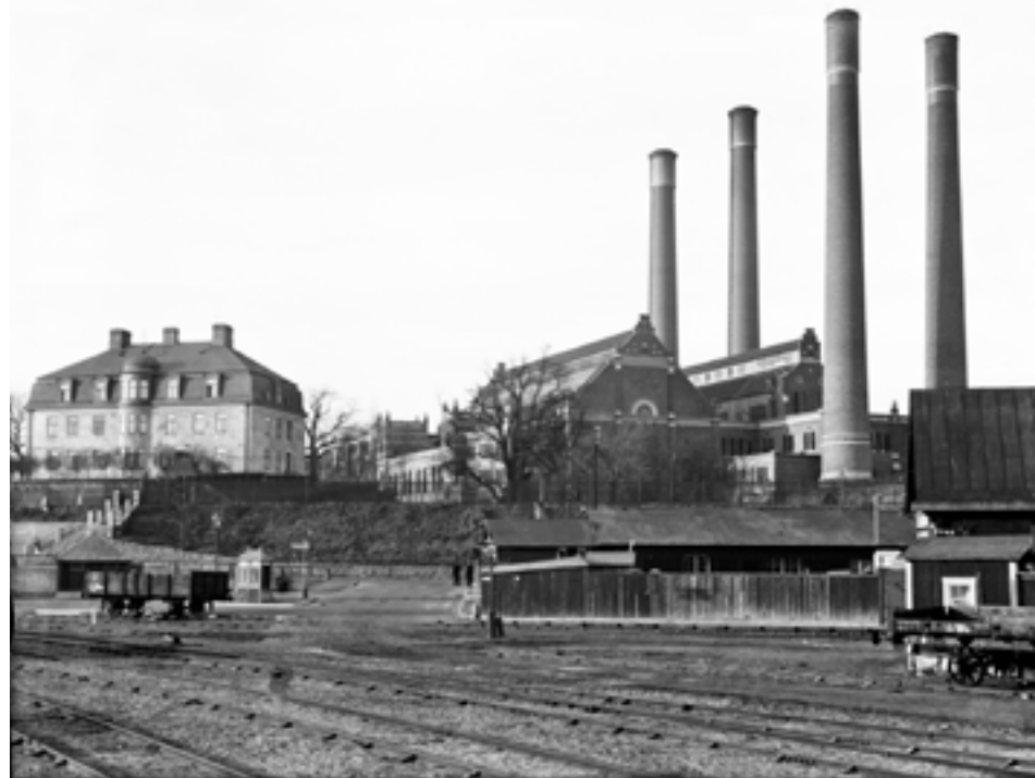
Värtaverket fotograferat från hamnen.

Torsten Ahltin lät mig också följa ned in i modellverkstäderna och titta på när modellmakarna arbetade med sina otroligt detaljrika arbeten. Allt