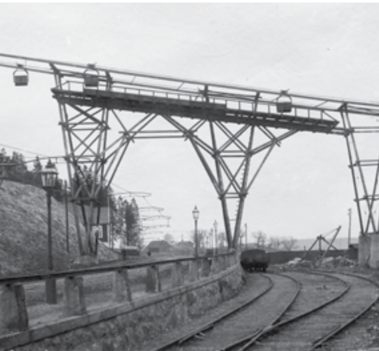
Ovanför Lidingövägen passerar linbanans korgar fyllda med kol.

Ring gärna 070-314 75 31 eller skriv till Lasse Erikson, Skarpbrunnsvägen 29, 145 65 Norsborg.