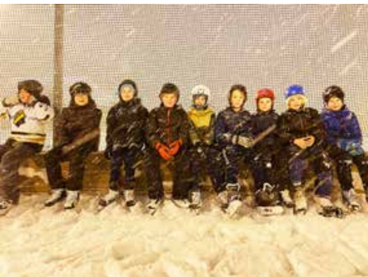
När snön låg djup på Hjorthagens IP, flyttade P10 träningen till isen på Östermalms IP.