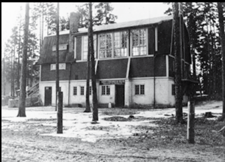
Hjorthagens Folkets Hus.

I övervåningen fanns en stor samlings-sal, som användes för möten, fester, boxning, brottning och som biograf. I markplanet Kooperativa föreningen Solids butikslokaler. 1922 byggdes huset ut med en vinkelbyggnad.