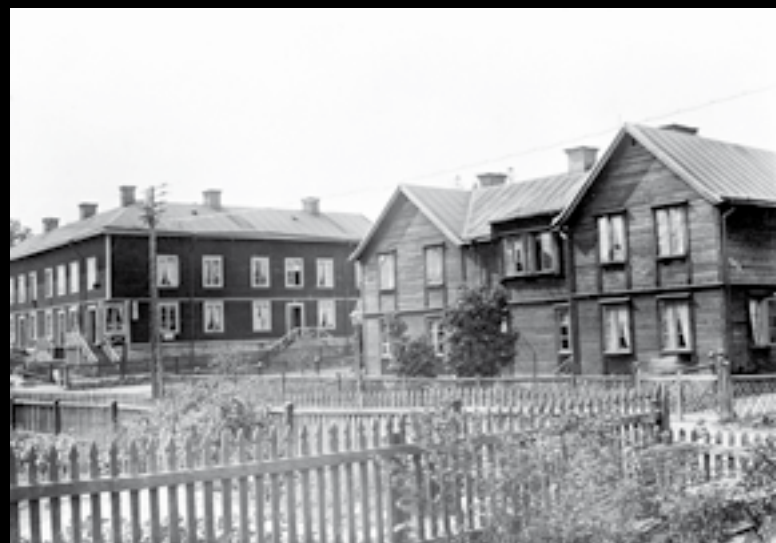
Bebyggelsen på andra sidan Skogvaktargatan, fram till 1921 Åttonde gatan.