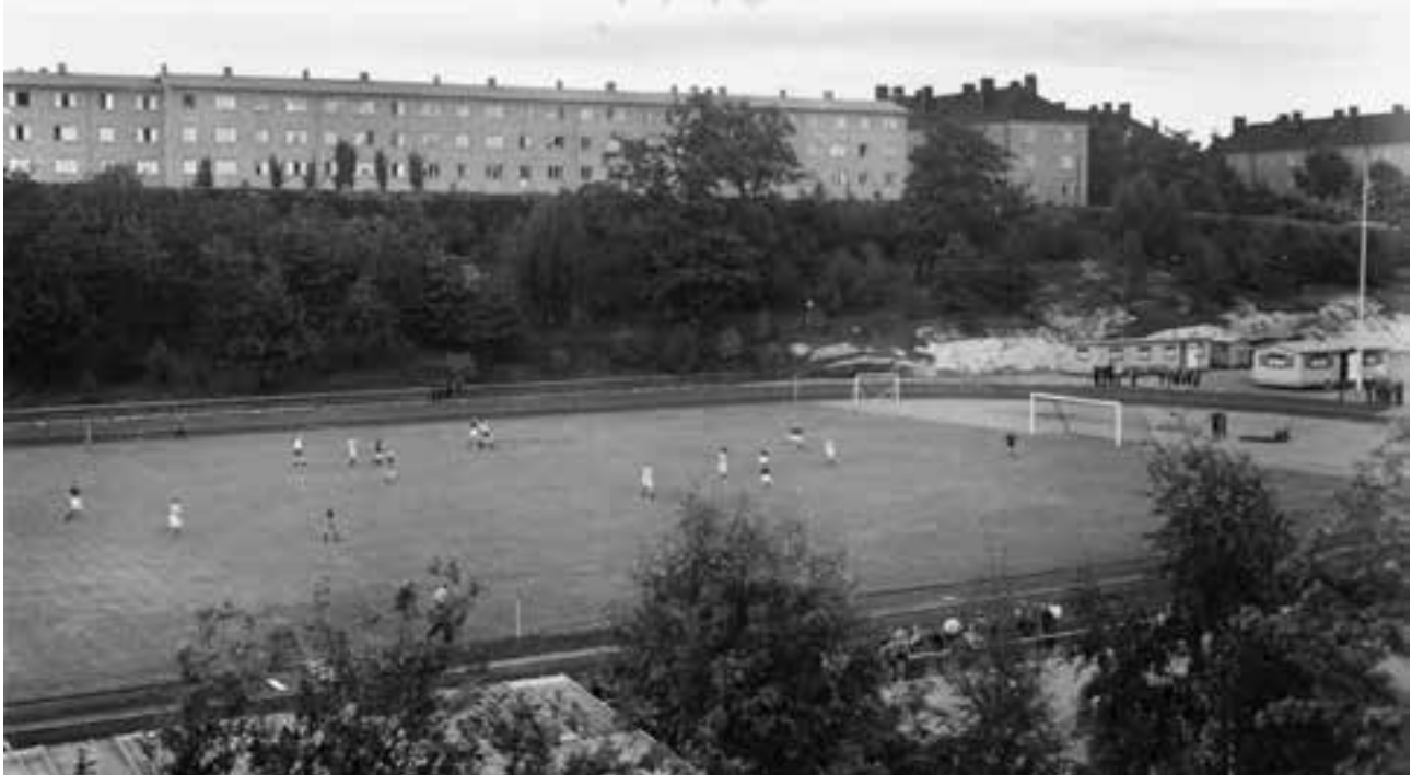
Hjorthagens IP 1946. Barackerna till höger är omklädningsrummen. Trähuset på berget, med omklädningsrum i nedre planet och matbespisning i det övre byggdes först 1947.