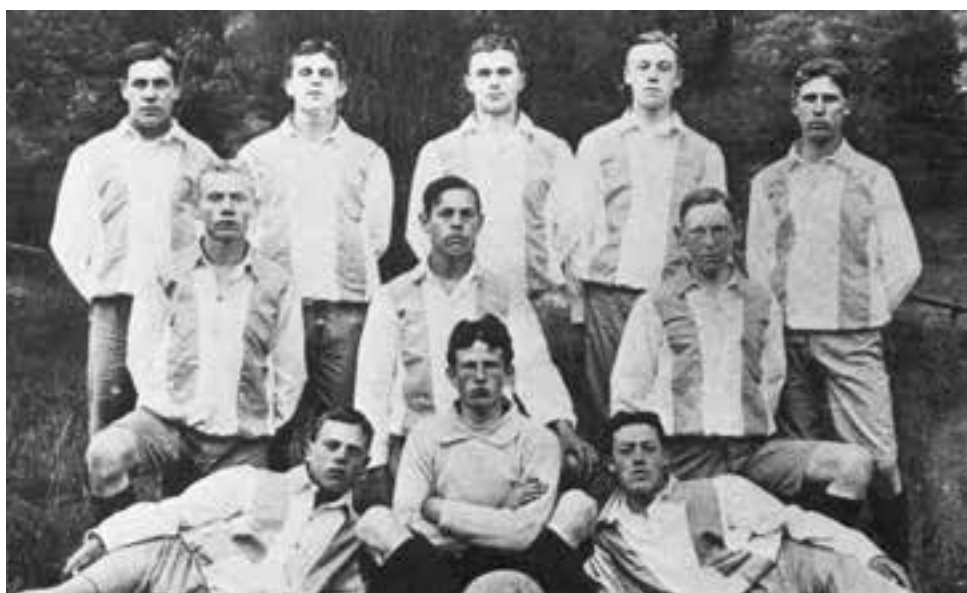
Värtans IK:s allra första lag 1911. De blåvitrandiga skjortblusarna ersattes ganska snart med enfärgade blå trikåtröjor. Blått har alltid varit Värtans IK:s färg, antagligen med tanke på Lilla och Stora Värtans vatten.