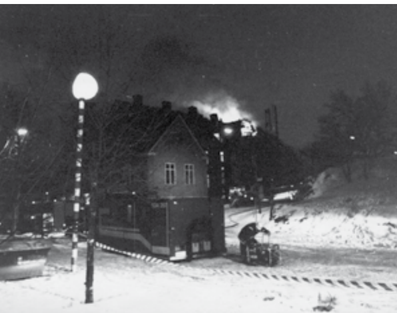
Skolan i lågor, 1993.

Personerna i Helge är påhittade, men detaljer har ofta sin motsvarighet i verkligheten.