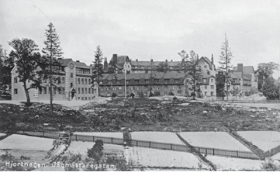
Hjorthagens nya skola, 1925.