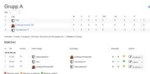
Tabell och matcher