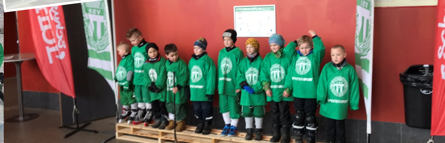
Bandyskolan P13 GULD :året 2020/2021