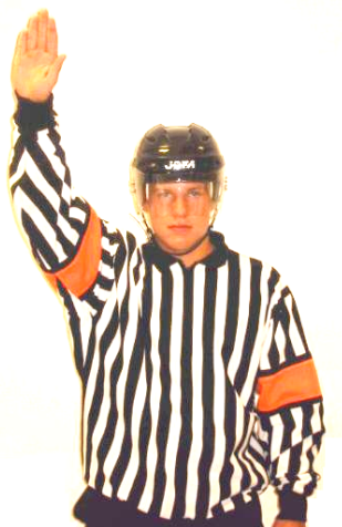
Player change Spelarbyte Regel 412