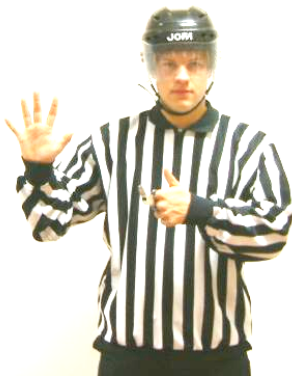
Too many players on the ice För många spelare på banan Regel 573