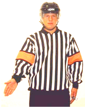
Hand pass Handpassning Regel 490 HANDL-P