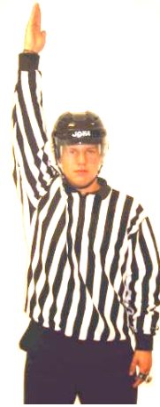
Dealyed icing/offside Avvaktande icing/offside Regel 451, 460