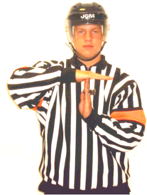
Time-out Time-out Regel 422