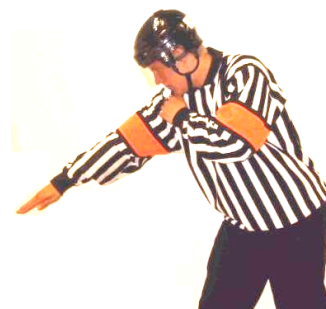
Goal scored Mål Regel 470