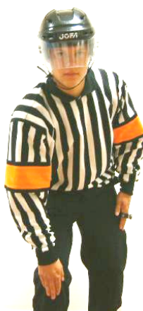
Kneeing Knätackling Regel 536 KNEE