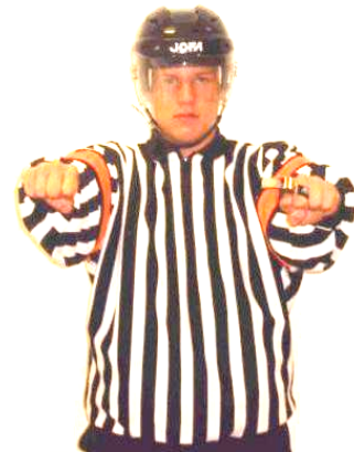
Cross-checking Tackling med klubban Regel 525 CROSS