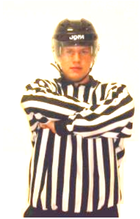
Icing Icing Regel 460