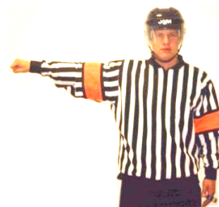
Roughing Onödigt hart spel Regel 528 ROUGH