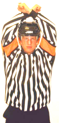
Penalty shot Straffslag Regel 508 P-SHOT