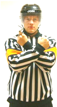
Interference Hindra spelare Regel 534 INTRF