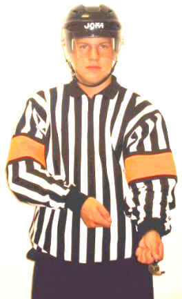
Spearing Stöt med klubbladet Regel 538 SPEAR