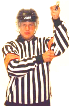
High sticking Hög klubba Regel 530 HI-ST