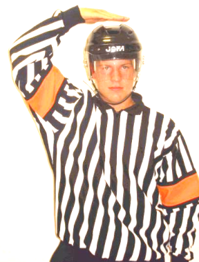
Match penalty Match penalty Regel 507