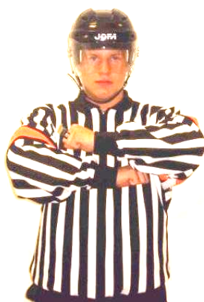
Charging Otillåten tackling Regel 522 CHARG