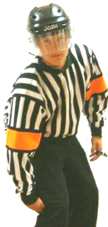
Clipping Låg tackling Regel 524 CLIP