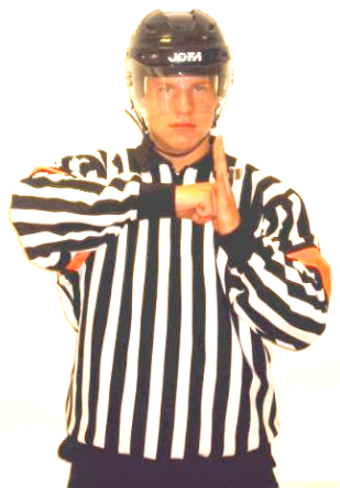
Boarding Våldsamt tackling mot sargen Regel 520 BOARD