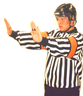
Checking from behind Tackling bakifrån Regel 523 CHE-B