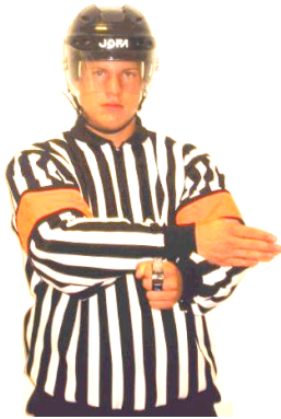
Slashing Slag med klubban Regel 537 SLASH