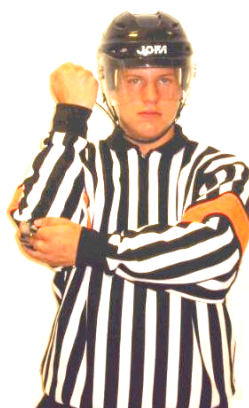
Elbowing Armbågstackling Regel 526 ELBOW