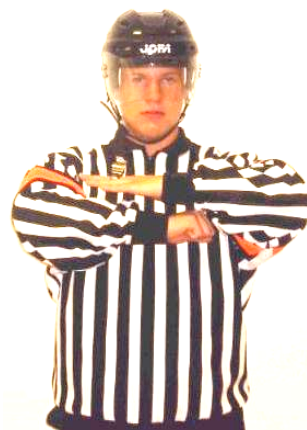
Butt-ending Stöt med klubbknoppen Regel 521 BUT-E