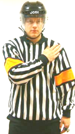
Body-checking Kroppstäckling Regel 601, 660 BODY-CH