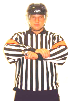
Holding Fasthållning Regel 531 HOLD