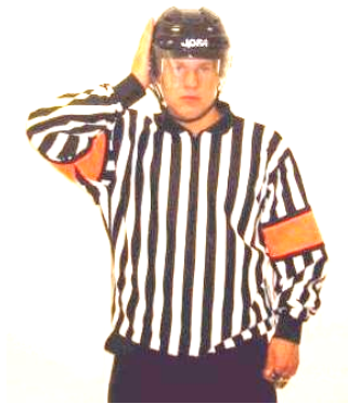
Checking to the head Tackling mot huvudet Regel 540 CHE-H