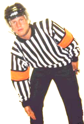
Tripping Slag på skridskon Regel 539 TRIPP