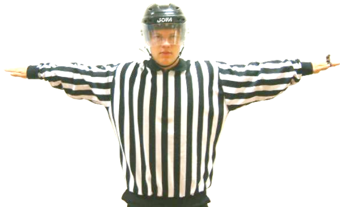
Wash-out Ingen åtgärd