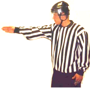
Offside Offside Regel 450