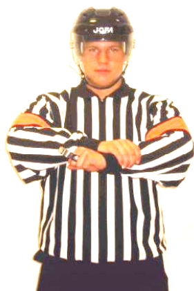
Holding the stick Fasthållning av klubban Regel 532 HO-ST