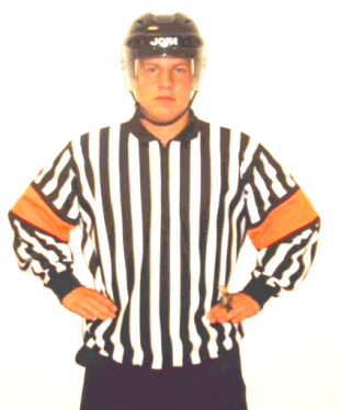
Misconduct penalty Misconduct penalty Regel 504, 550-553 ABUSE