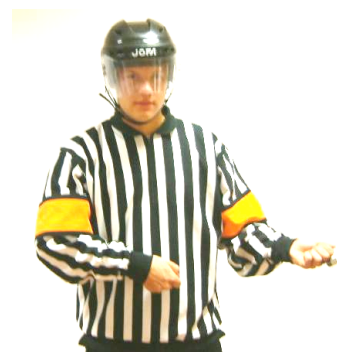
Hooking Hakning Regel 533 HOOK