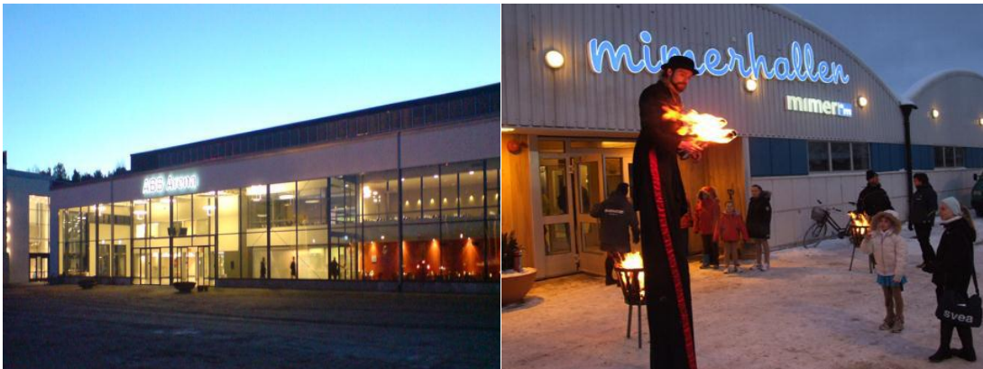
ABB Arena Huvudarenan på Rocklundaområdet

Mimer Hallen Inomhusrink /träningshall med läktare