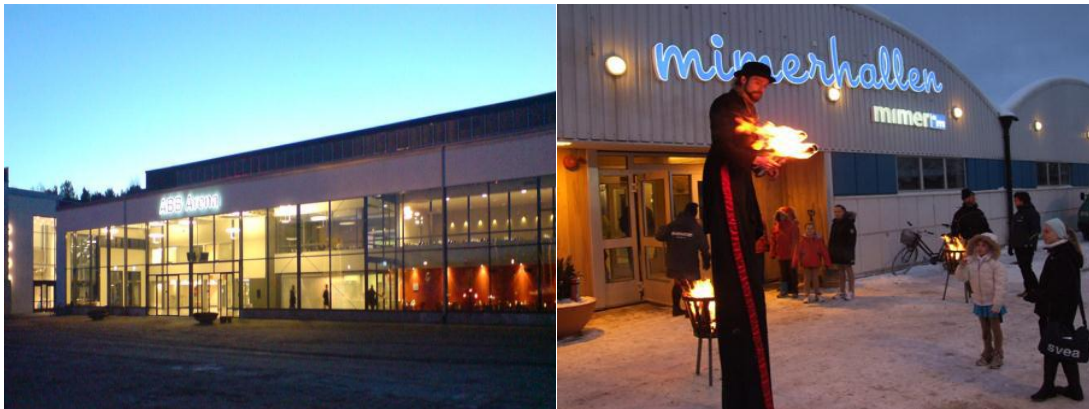
ABB Arena Huvudarenan på Rocklundaområdet

Mimer Hallen Inomhusrink /träningshall med läktare