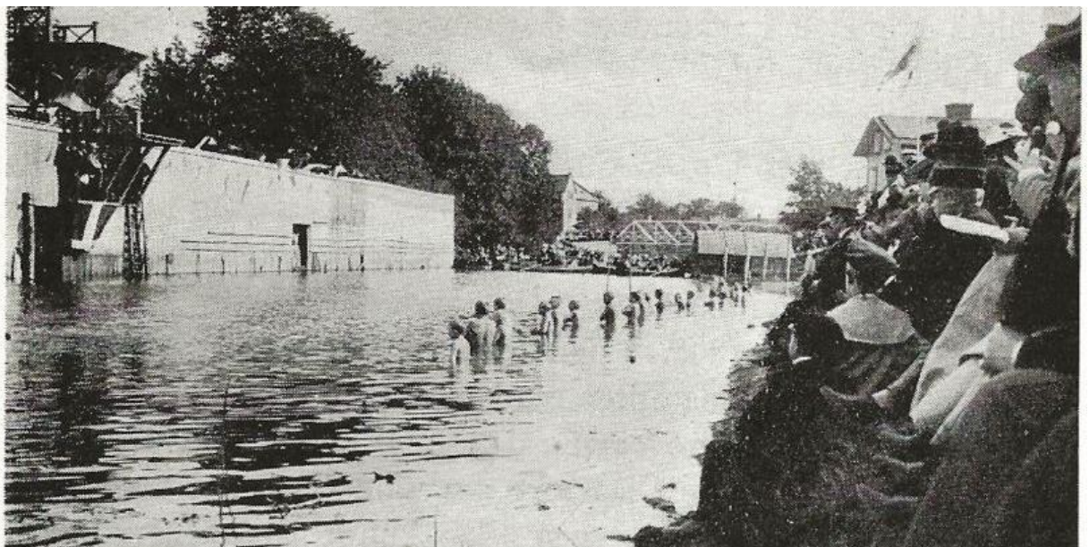
Simpromotion 1901. Man simmade över ån och ställde upp sig på linje i vattnet

Vattenpolomatch ses pågå här i Fyrisån. US och Sirius fanns som Uppsalalag då. Bilden sannolikt från 1910-talet eller lite senare.