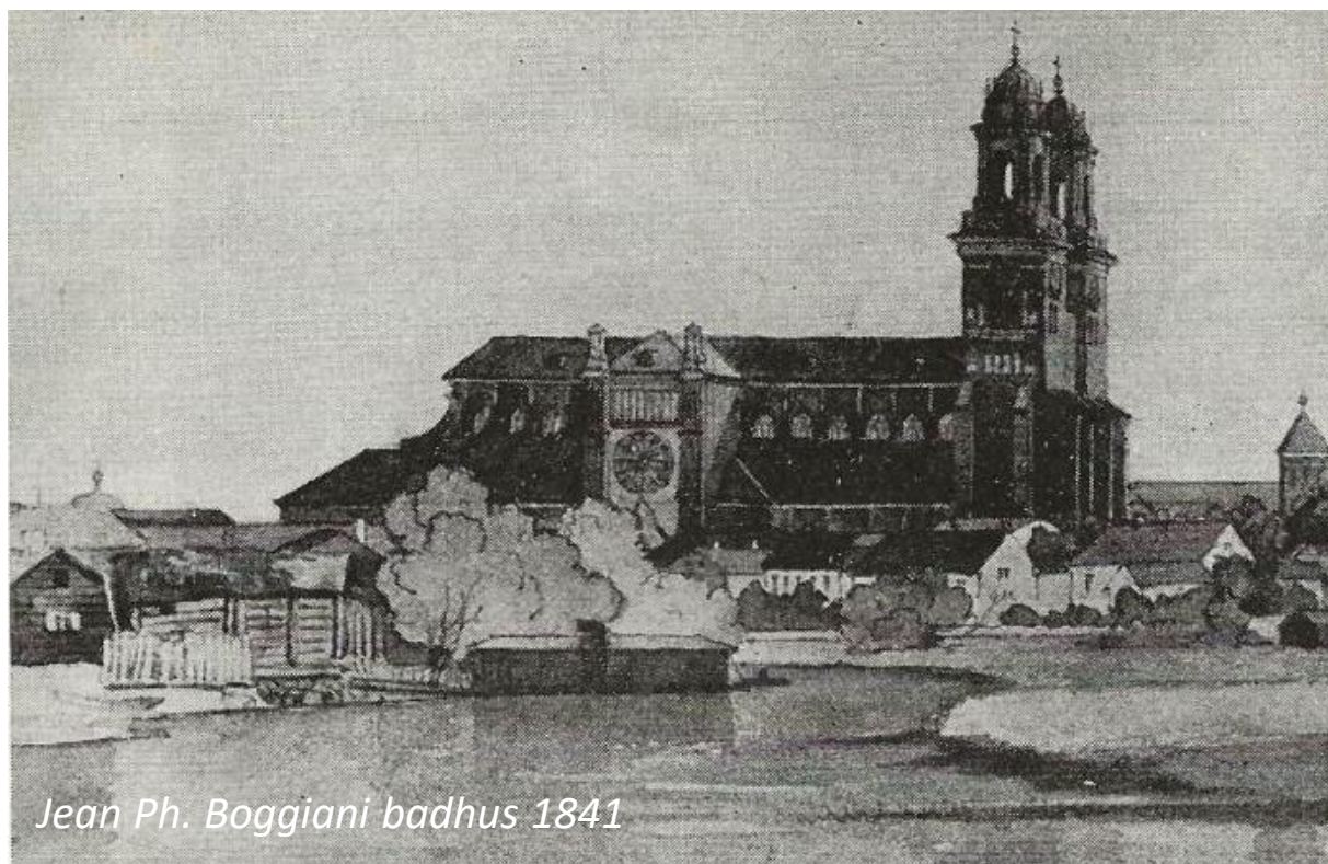
Jean Ph. Boggiani badhus 1841

Här låg första badhuset i Fyrisån. Platsen är strax söder om Haglunds bro på Skolgatan, som då hette Ladugatan. En bro som kom att uppföras 60 år senare och numera är ersatt av en ny bro i samma stil. Dock har det funnits förbindelser över ån på platsen tidigare, vilket inte framgår av denna akvarell av konstnären G. W. Palm.