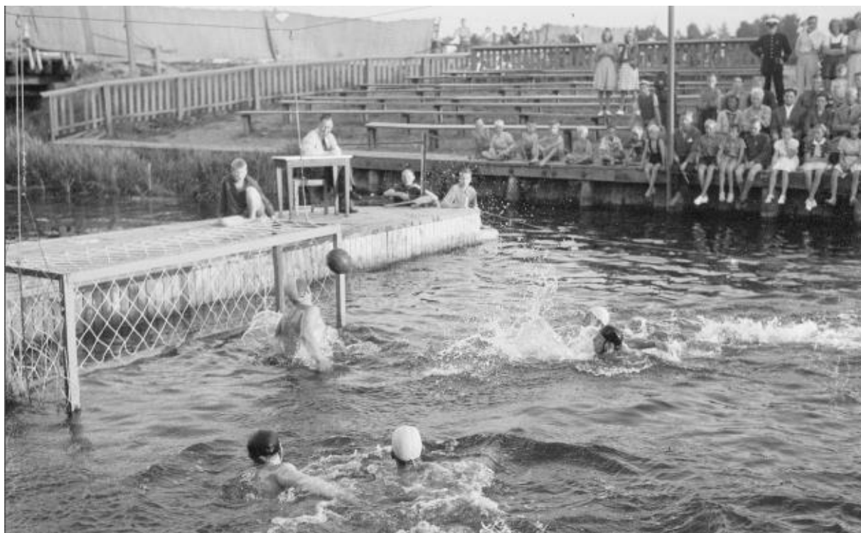
DM i vattenpolo 1948. Sverige hade ett vattenpololag i OS i London ungefär samtidigt. Troligtvis match mellan Uppsalas två lag – US och Sirius.

År 1900 kom vattenpolo på programmet som den första lagsporten under olympiska spelen i Frankrike. Då hade sporten ändrat karaktär – med dribblingar och passningar påminde den mer om handboll i vattnet än om ett krig mellan två grupper av slagskämpar.