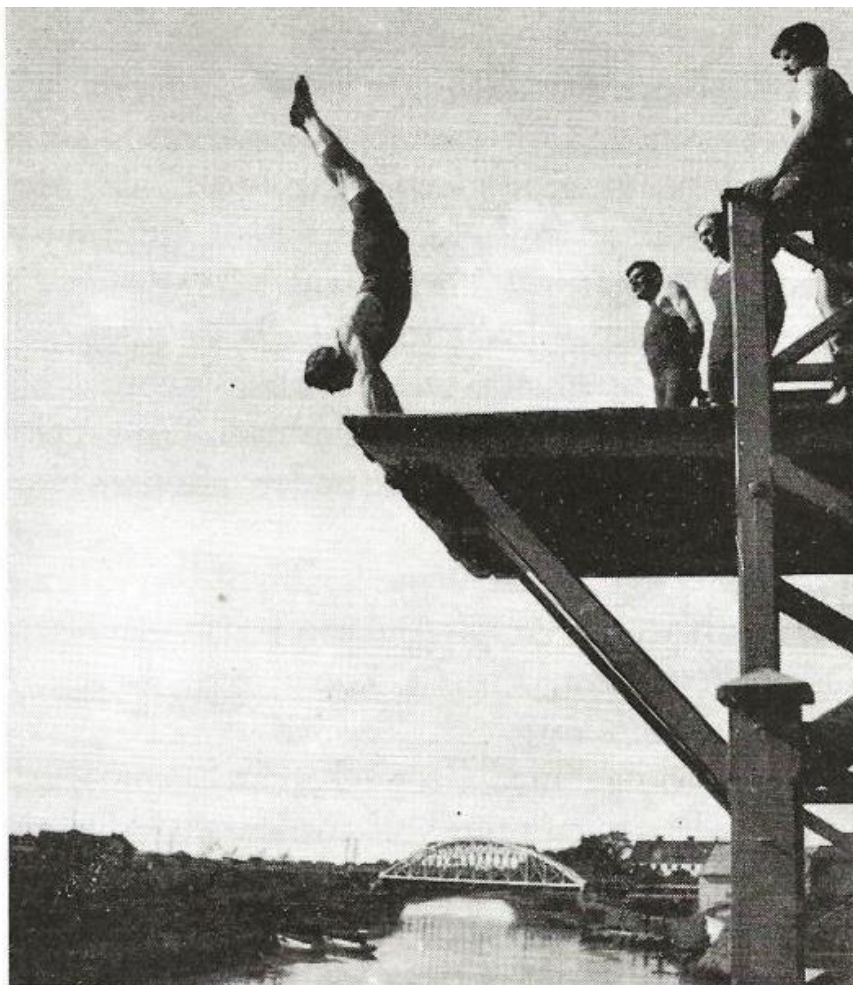
Järnvägsbron ses här från hopptornet vid Svartbäckens kallbad