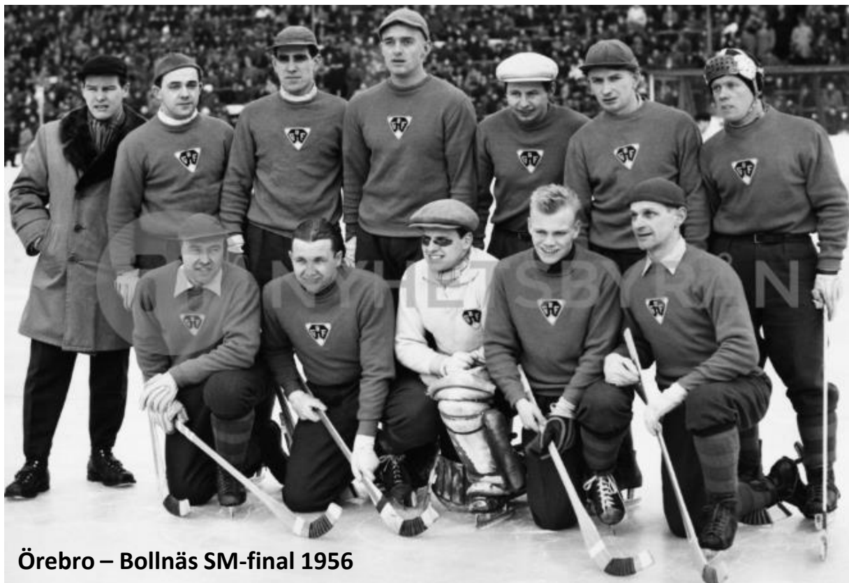
Örebro – Bollnäs SM-final 1956

Pohjanen gjorde två av målen i semifinalen mot Edsbyn 1963 uppe i Edsbyn på Ön. Skridskoåkningen var hans styrka. Brandman med styrka och kondition.