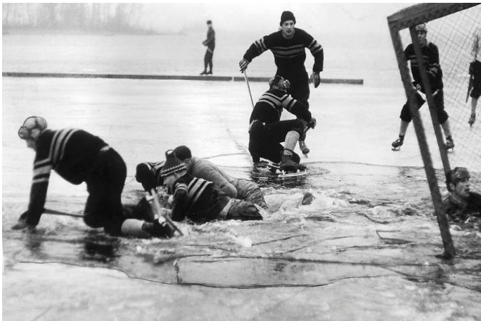
I bandy kan det gå hett till och spelarna kan behöva svalka av sig. Alla klarade sig bortsett från en å annan kallsup. Plats Storsjön.

Boll eller trätrissa, liknande en puck, användes lite varierande i början men 1905 bestämde man att det var med boll man skulle spela och matcher spelades i början på sjö-is, eller som i Uppsala, på "Fyr-is". Risken att "plurra" vid riskfull temperatur närmare vårkanten var stor och snart började man istället spola is på landbacken.