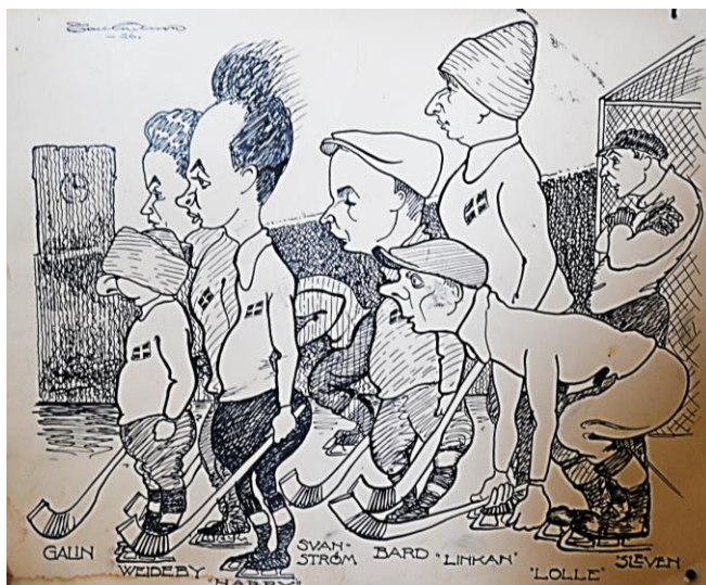
Linkans legendariska lufa och Sleven i målet med sin lika legendariska mössa