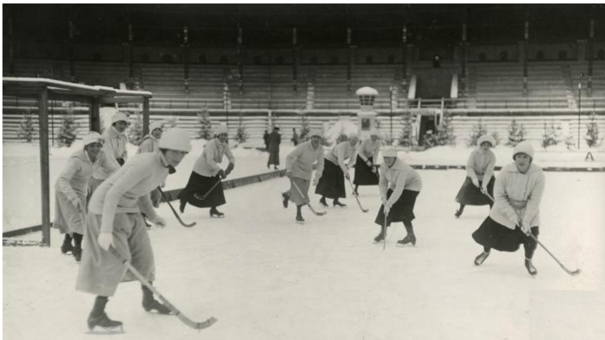
Kronprinsessans Hockeyklubb bildades 1908 av kronprinsessan Margaretha som är någon av spelarna här på bilden

Bandysporten har alltid varit damernas riddare. Medan fotbollen och ishockeyn kom igång sent med tävlingsverksamhet för kvinnor var bandysporten tidigt ute. Redan 1908 bildades Kronprinsessan Margarethas Hockeyklubb - Margaretha var första gemål till dåvarande kronprinsen Gustaf Adolf. Alltså nuvarande kungens farmor.