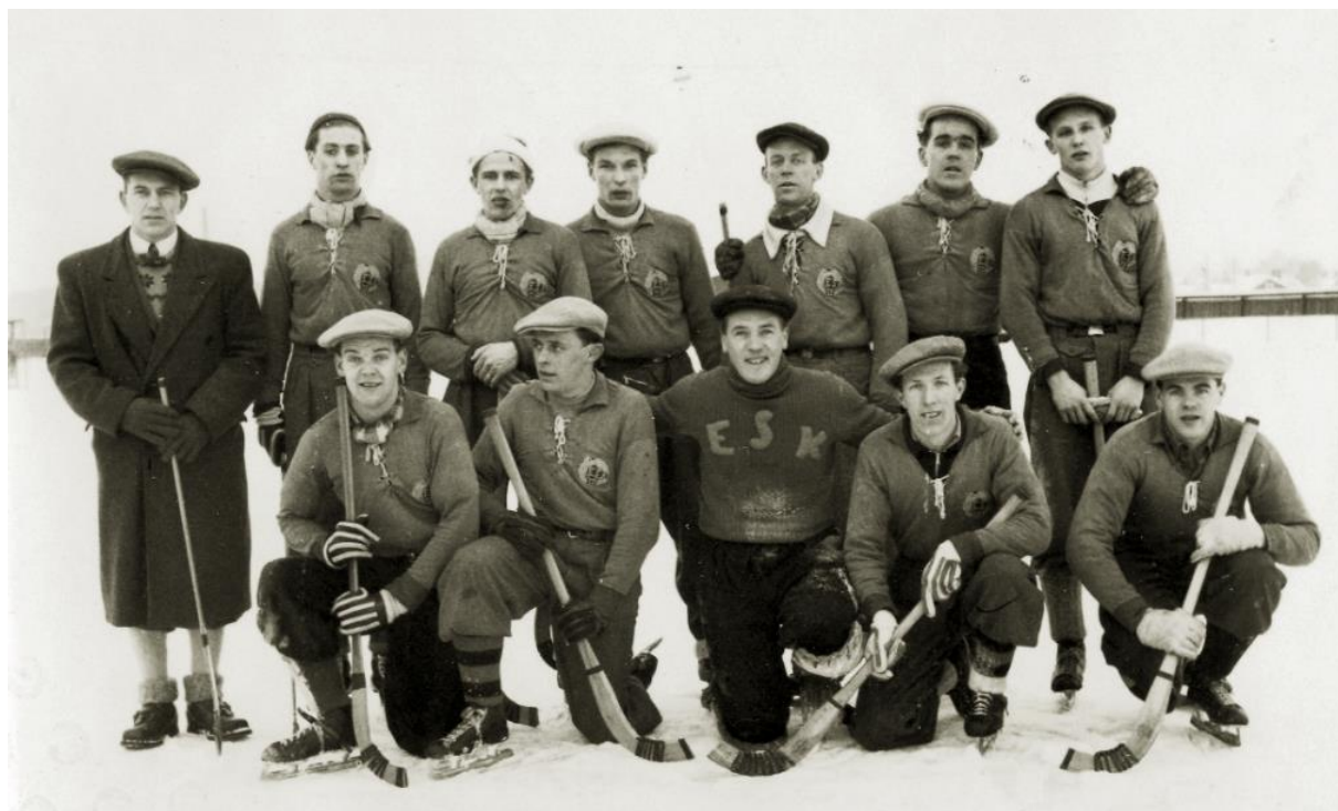
ESK's bandyteam vid DM-match mot Sirius 1947

1970 startade man igen och har fortsatt sedan dess, men nu på motionsnivå. De flesta spelarna har varit "pensionerade" fotbollsspelare och ishockeyspelare, och nästan alla hemmamatcher har spelats i Uppsala.