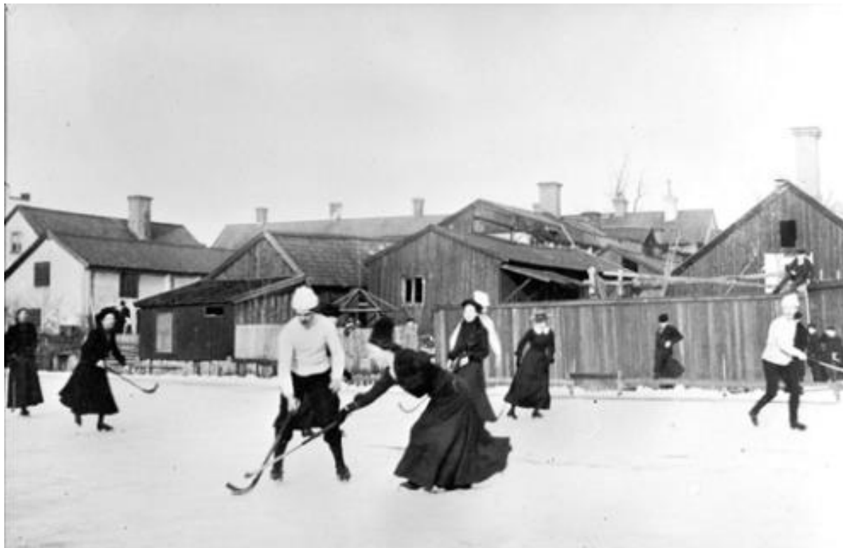
Kvinnor och män spelar bandy tillsammans på Fyrisåns is i början av 1900-talet. I bakgrunden ses gårdsbebyggelsen i kvarteret Lindormen i Svartbäcken.

Bandyspelande damer är mycket äldre än de flesta har en aning om.