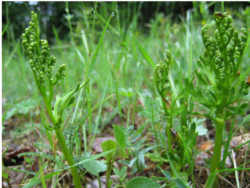
Topplåsbräken Leåhägena. "Botrychium lanceolatum"

(Senare har även observerats johannesört, fibblor, ängsskallra och ögontröst).