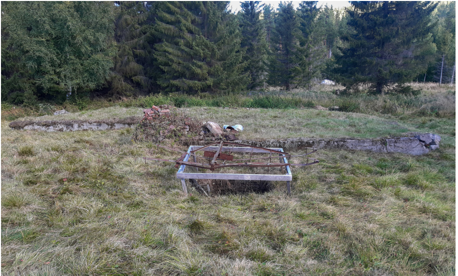
Installation Leåtorpet. Underredet av ett åkdon placerat ovanför brunnen, framför lagårdsgrunden.