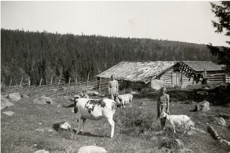
Leåtorpet i början av 1940-talet. Systrarna Fahlen, Margit (gift Sjöström och Elsa (gift Backlund) passar djuren.