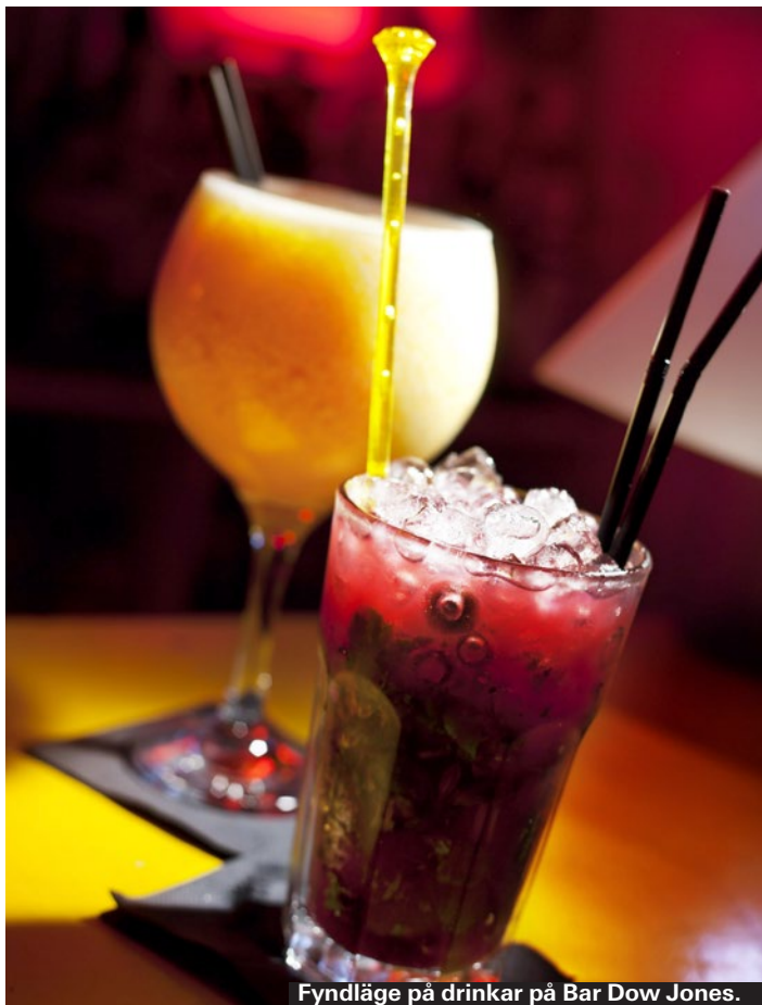
Fyndläge på drinkar på Bar Dow Jones.

► Carrer Sant Pere Més Alt, 31-33, (El Born) ► www.facebook.co/bar.pasajes