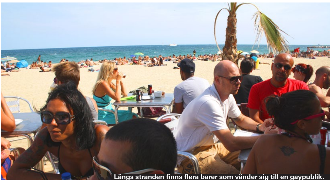
Längs stranden finns flera barer som vänder sig till en gaypublik.