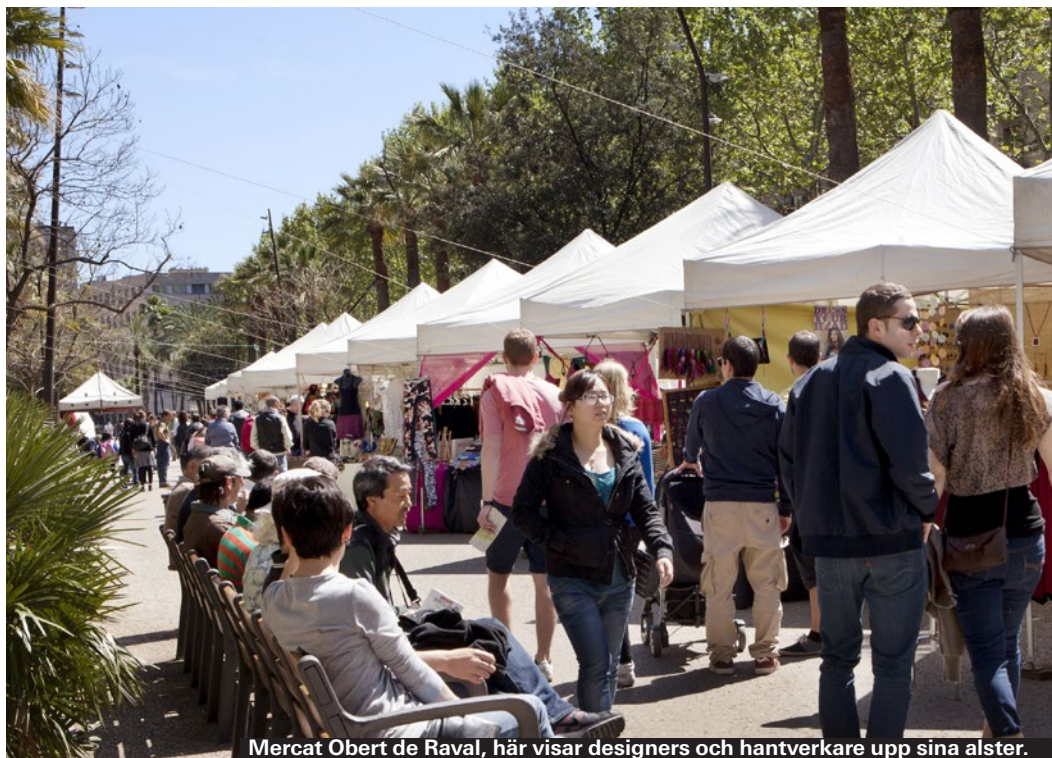
Mercat Obert de Raval, här visar designers och hantverkare upp sina alster.