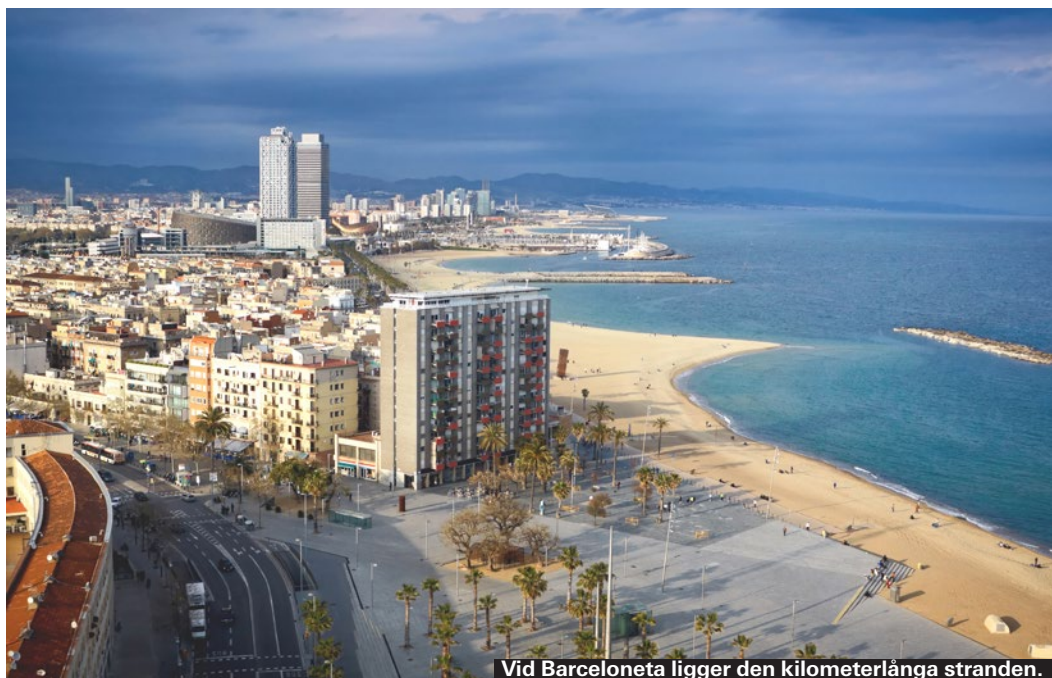
Vid Barceloneta ligger den kilometerlånga stranden.