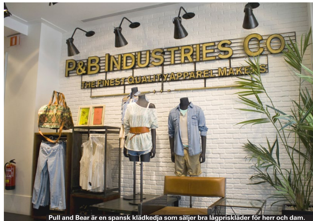
Pull and Bear är en spansk klädkedja som säljer bra lågpriskläder för herr och dam.