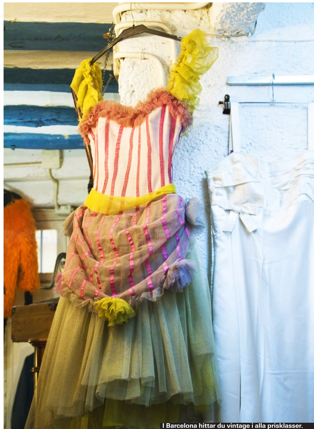
I Barcelona hittar du vintage i alla prisklasser.