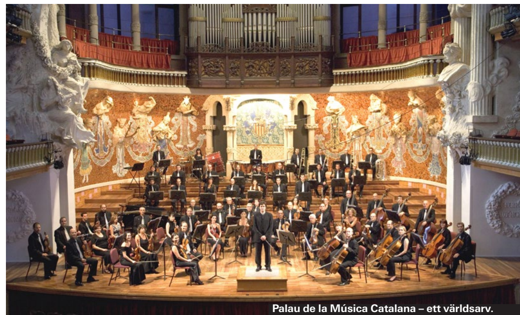
Palau de la Música Catalana – ett världsarv.

► Carrer Botella, 7 (Raval) ► www.bigbangbcn.com