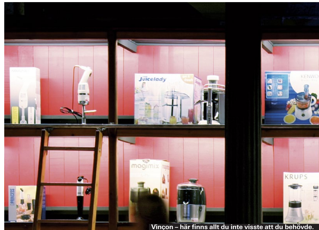
Vinçon – här finns allt du inte visste att du behövde.

Det råder vintagefeber i Barcelona och större happenings med secondhand-kläder anordnas varje månad. Ofta finns en bar och ett dj-bås i anslutning, vilket ger trendiga Barcelonabor ytterligare anledningar att dyka upp. Lost and found anordnas en hel tredje månad inne på tågstationen Estació França i Born eller nere på stranden i Barceloneta. En annan att hålla koll på är L'Ovella Negra. ► www.landfmarket.com/en ► www.twomarkets.es