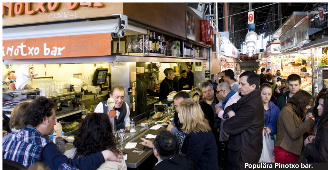
Populära Pinotxo bar.

► Passatge de la Concepció 12 (Eixample) ► www.bocagrande.cat