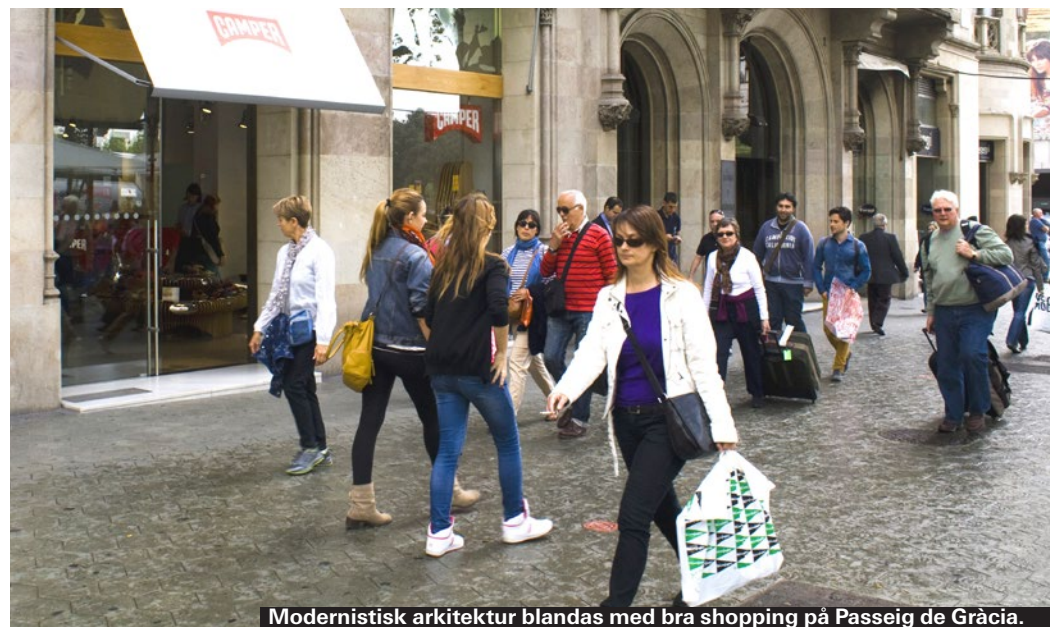
Modernistisk arkitektur blandas med bra shopping på Passeig de Gràcia.