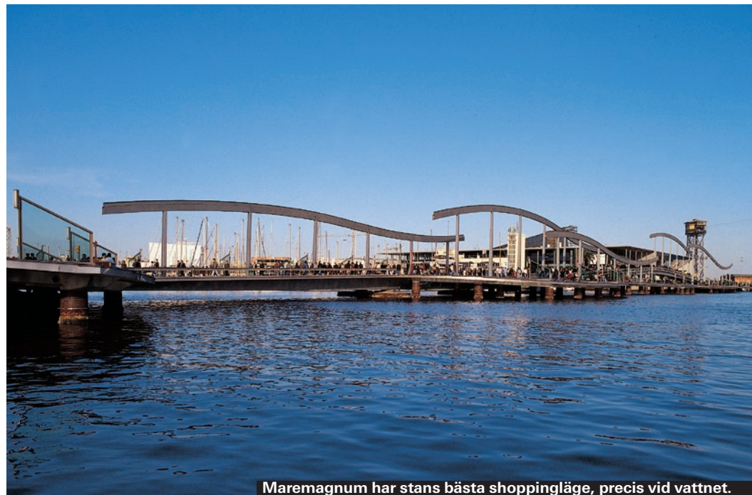
Maremagnum har stans bästa shoppingläge, precis vid vattnet.

▶ Calle Potosí, 2 (Sant Andreu) ▶ www.lamaquinista.com