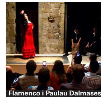
Flamenco i Paulau Dalmases.

nära Ramblan i Ravals nedre, ruffigare kvarter. Livemusik alla kvällar. Fredagar brasiliansk, övriga dagar bland annat blues. ▶ Carrer Nou de la Rambla 34 (Raval)