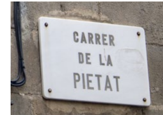
Carrer betyder gata.

Barcelonas taxibilar är alla gula och svarta, de är billigare än i Sverige och enkla att haffa på gatan. Ett extra tillägg på några euro tillkommer på natten eller om du har mycket bagage. Alla följer samma taxa. Du