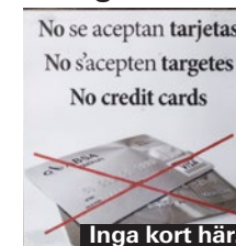
Inga kort här.

Det är långt ifrån självklart att kunna betala med kort på alla ställen. Både större mataffärer och taxichaufförer kan kräva en viss minimi-summa. Det är inte ovanligt att se en skylt utanför mindre barer och restauranger som informerar om att det är kontanter som gäller. Det är säl-