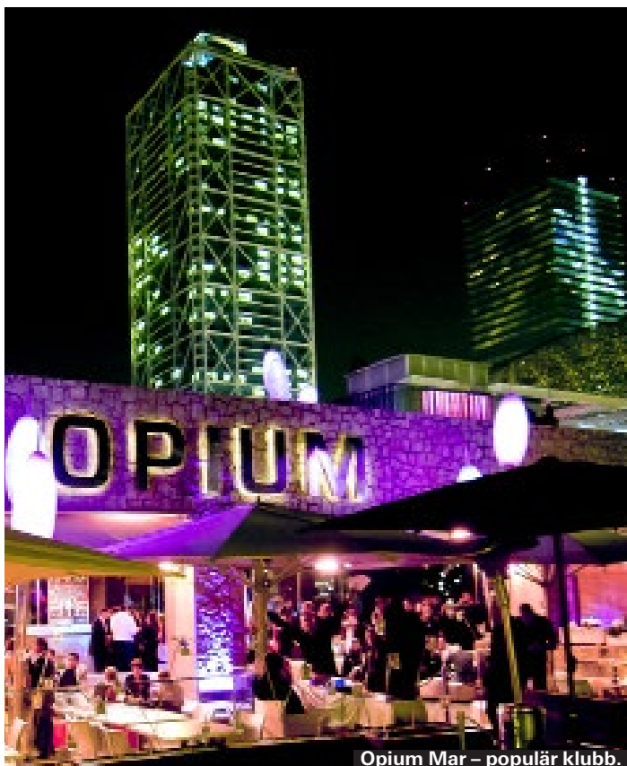
Opium Mar – populär klubb.

Största nattklubben i stan har fem dansgolv med olika musik som techno, elektro, pop, rock och dubstep. Här hålls även stora konserter. Döpt efter en låt av The Pulp och kallas oftast bara "Razz", med läspande z på slutet. Kom tidigast halv två, innan dess börjar den extremt stora