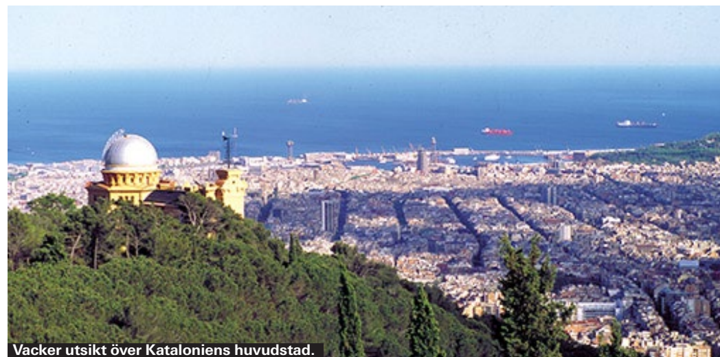
Vacker utsikt över Kataloniens huvudstad.