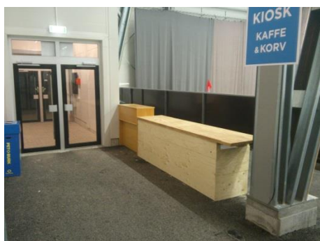
Vyer över Recoverhallens fasta kiosk.