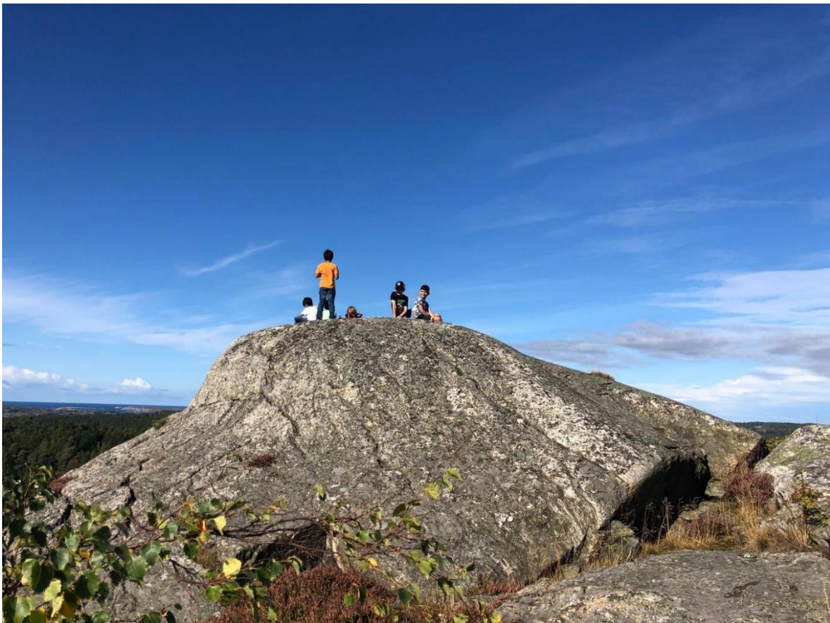
Bilder: Utsikt Hartippen

Hösten kom allt närmare. Måndagen den 29 augusti blev det i sommarens sista sprint för alla. I slutet av augusti formade vi det framgångsrika torsdags konceptet vid Källekärrens skolgård. Mer om detta i nästa avsnitt!