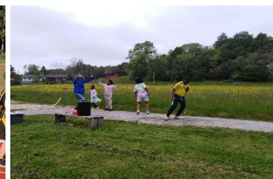
Bilder: sommaren 2022