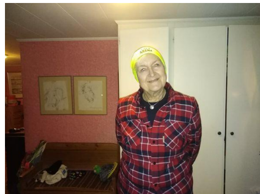
Bilder: vintern 2022