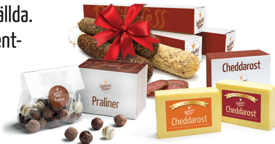
Rosett ingår ej.

En mycket bra gåva där både säljare och köpare är vinnare; idrottsföreningar/ skolklasser tjänar pengar och företaget får en bra julklapp att ge bort.