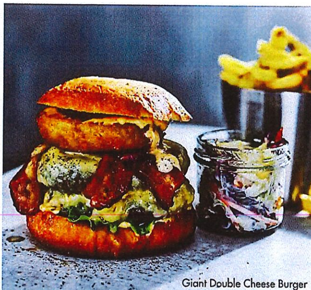
Giant Double Cheese Burger