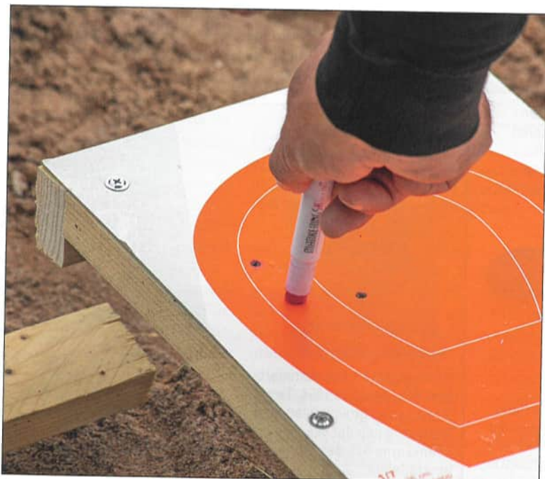
Se till att skytten fått möjlighet att höra och eventuellt protestera mot ett resultat innan du markerar kulhålen.