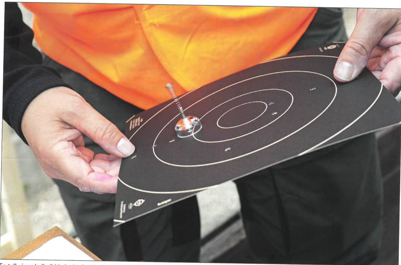
En tolkning skall alltid ske horisontellt, vare sig det är en spegel eller en fältfigur.