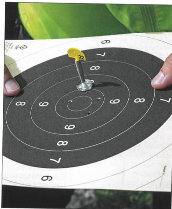
En icke godkänd tolkning. Se till att tolkarna du använder är godkända av Svenska Pistolskytteförbundet.

hellre fria än fälla och döma till skyttens fördel.