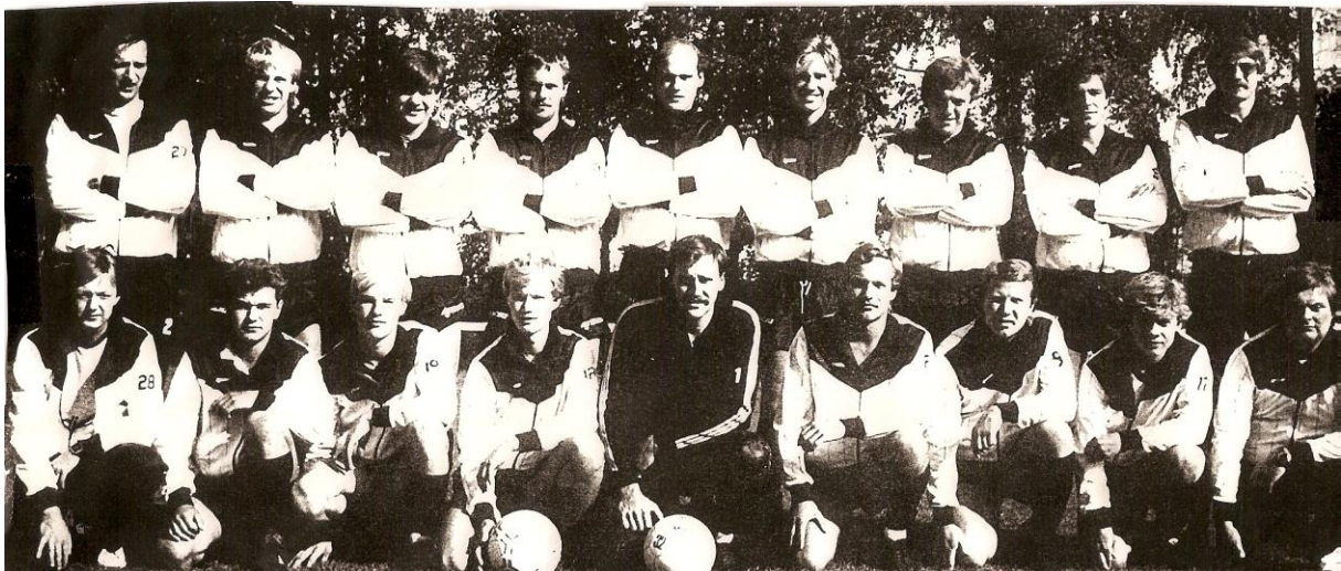
Vårt fotbollslag modell 1984