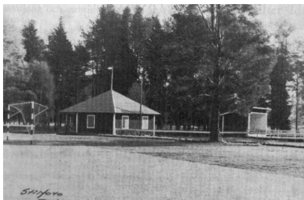
Paviljongen vid Hedens IP

oanvänd och i stort behov av renovering så beslutades det att densamma skulle rivras, vilket också påbörjades under 2012. Officiellt invigs Heden den 17 augusti 1913 efter att Strömsbergs bruk ombesörjt byggnationen av paviljongen och markarbeten med hjälp av föreningens medlemmar.