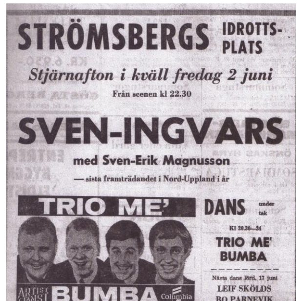
Sven-Ingvars besökte Hedens IP 1967

60-70 talen blev en bra tid för nöjessektionen då vi lyckades med att få hit Sven Ingvars som i början av 60-talet slog igenom på allvar. Det var en söndagskväll samtidigt som Barnens dag hade en mycket känd artist i Tierp. Jag målade min bil med texten att Sven Ingvars uppträder i Strömsberg ikväll kl. 20.00 och åkte runt i norduppland och visade upp detta. Det blev stor succè med över 2000 betalande.