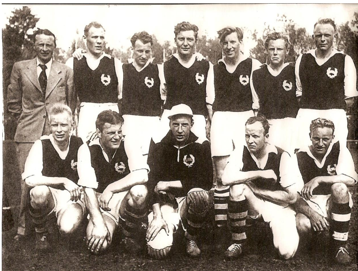
En upplaga från 50-talet