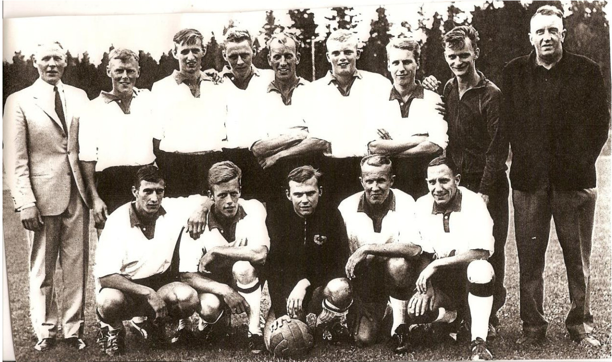
Vårt fotbollslag modell 1963