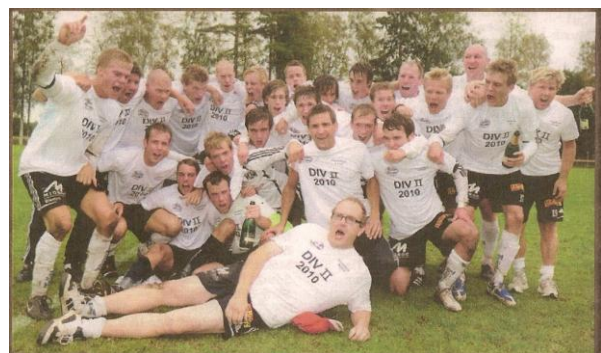
Laget som tog steget upp till Div II.

Flera medlemmar gör aktiva insatser för våra verksamheter – ännu fler behövs!