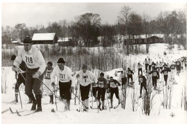
En upplaga av Distansloppet efter start i Dorkarby.