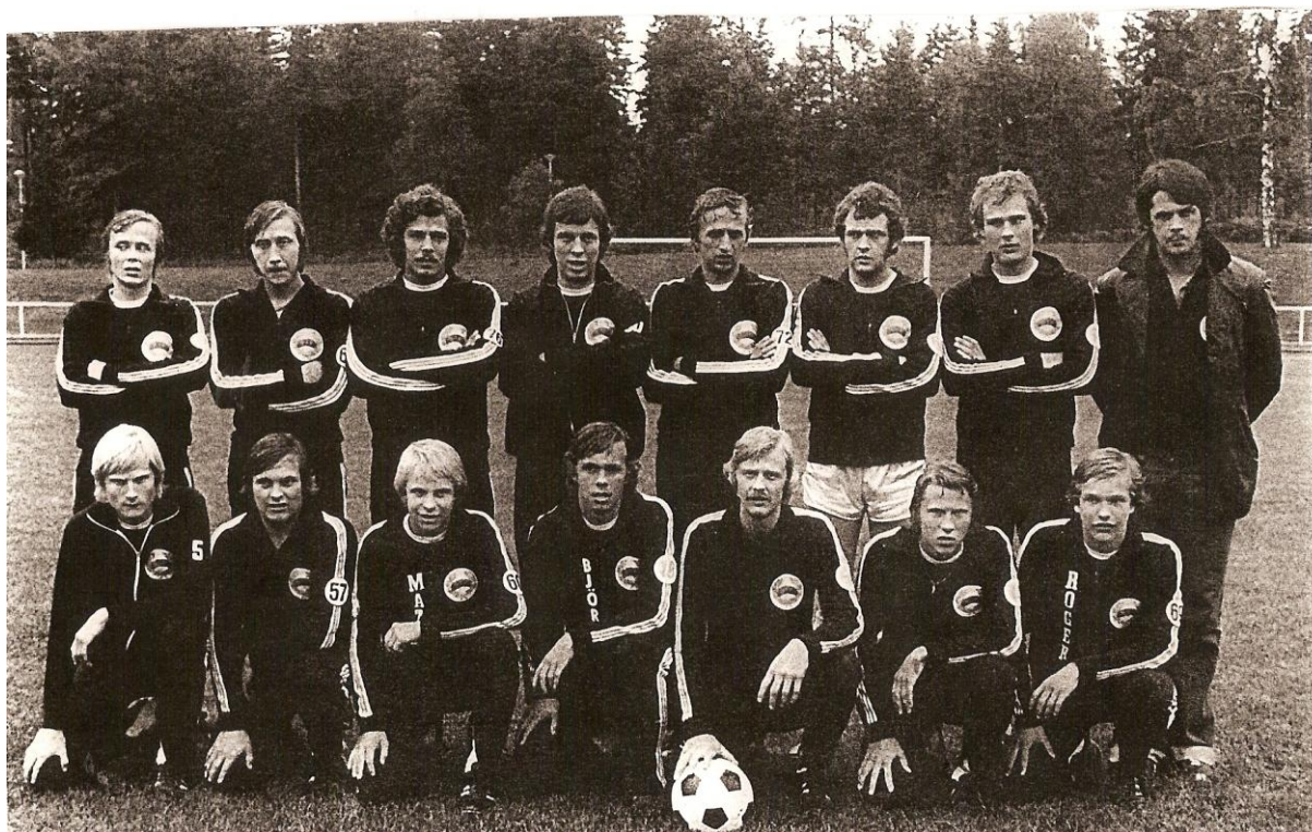
Vårt fotbollslag modell 1975