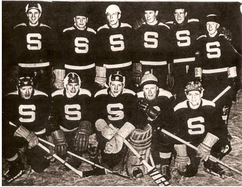
Hockeylag från 50/60-talet