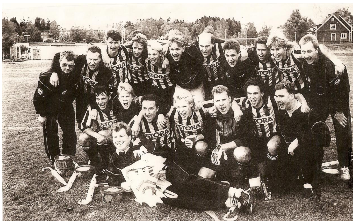
Serieseger i div IV år 1991