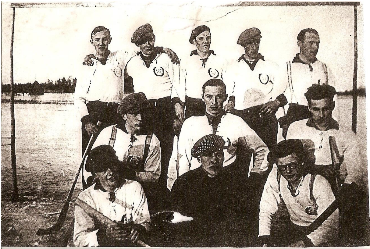
Bandytag från 30/40-talet