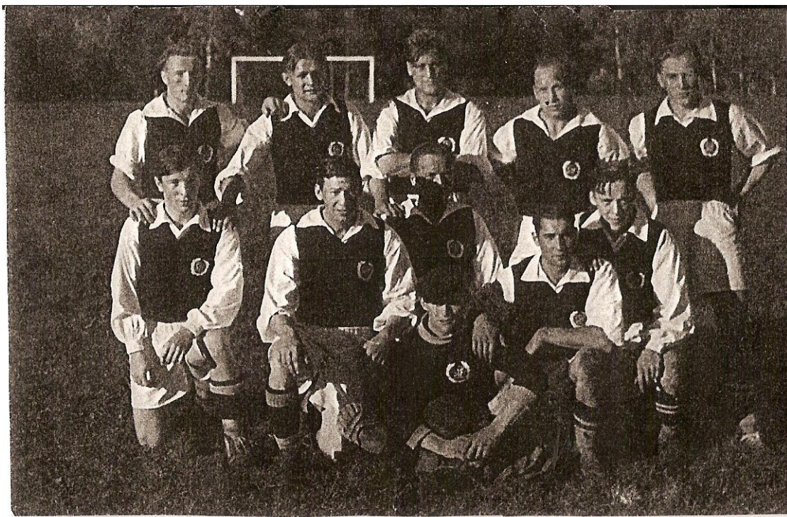
En fotbollselsva från kring 1939/1940