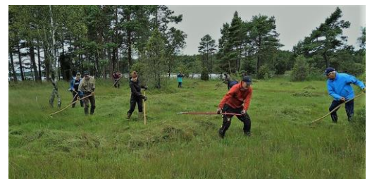
Lieslätter vid Björnekullakärret.

Gummistövlar och kläder efter väder! Efteråt bjuder nationalparkens personal på nygrillad korv med tillbehör samt kaffe/the. Medtag egen dricka Ansvariga är nationalparkens personal.