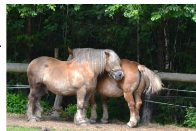
Två av Bångs hästar.

Väl mött till en intressant kväll! Ansvarig är Janne.