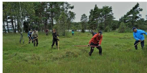
Lieslätter vid Björnekullakärret.

Denna fina lördagsförmiddag kommer vi återigen att slå med lie vid Björnekullakärret . De som har liar tar med det och övriga räfsor. (Det finns även några liar och räfsor för utlåning). Gummistövlar och kläder efter väder! Efteråt bjuder nationalparkens personal på nygrillad korg med tillbehör. Medtag egen dricka och kaffe/the. Ansvariga är nationalparkens personal.