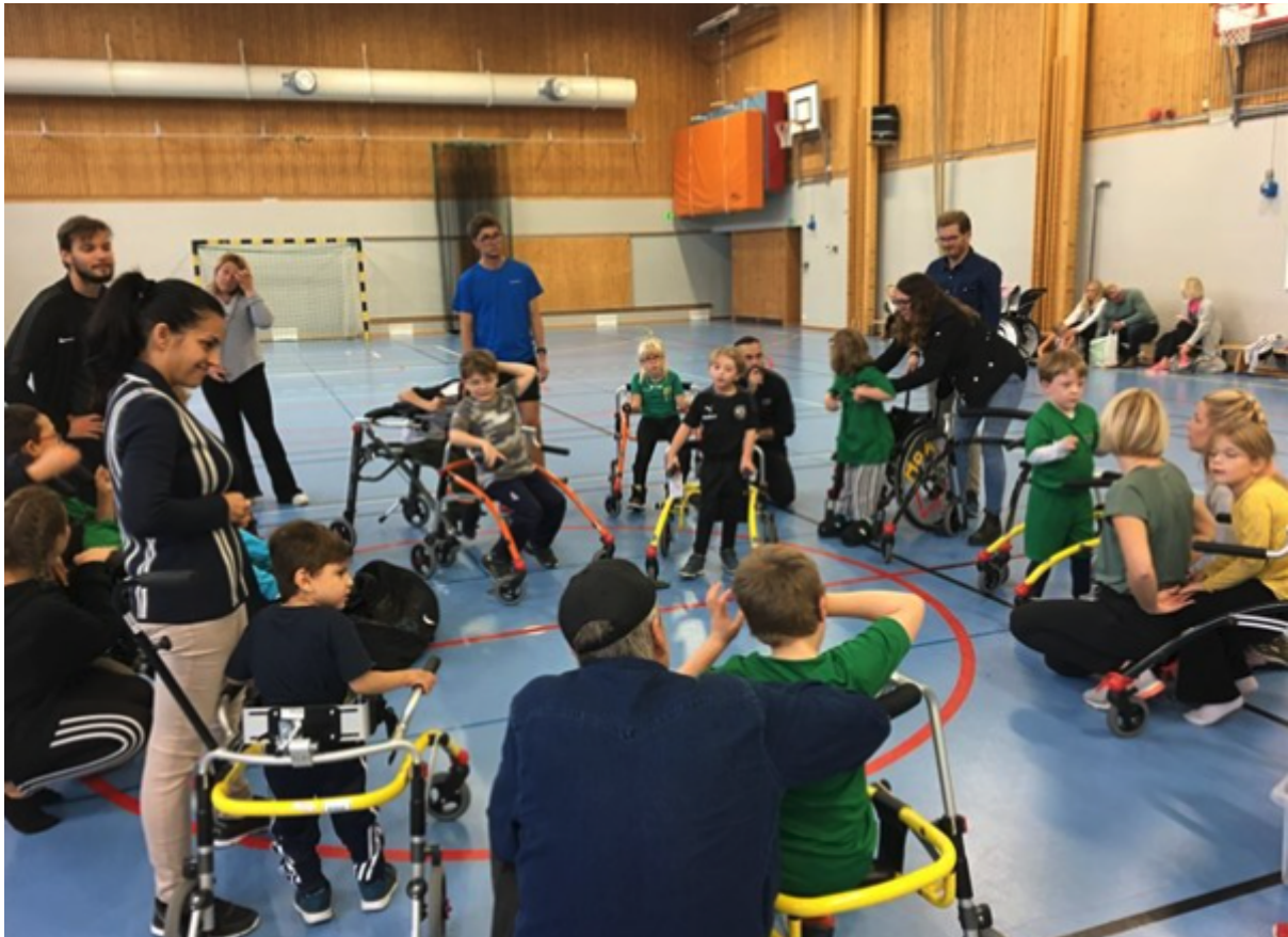
Bild: Samling på en av Stockholm Frame Fotbollsträningar

Stockholm Frame Fotboll är Sveriges första frame fotbollsklubb. Alla tränare och ledare arbetar helt ideellt och hjälps, tillsammans med spelare, föräldrar och