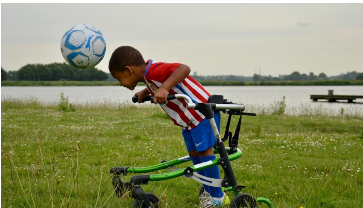
Bild: Frame fotbollsspelare testar en nick.