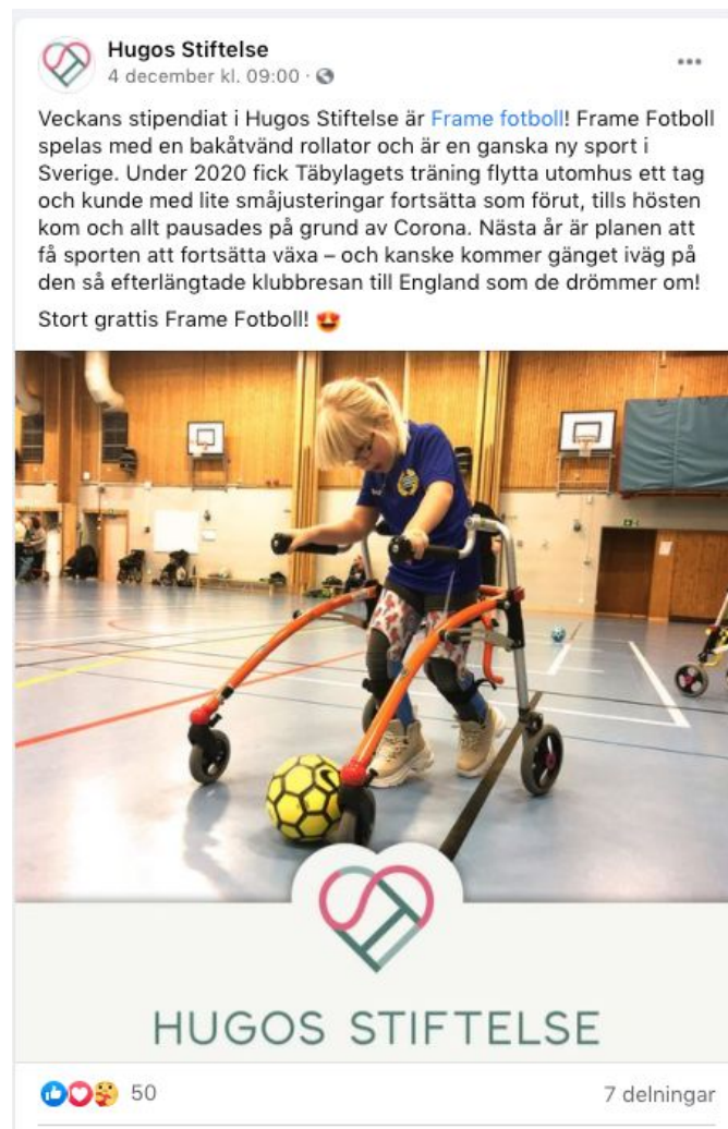
Bild: Stockholm Frame Fotboll fick 10 000 kronor i stipendium av Hugos stiftelse.