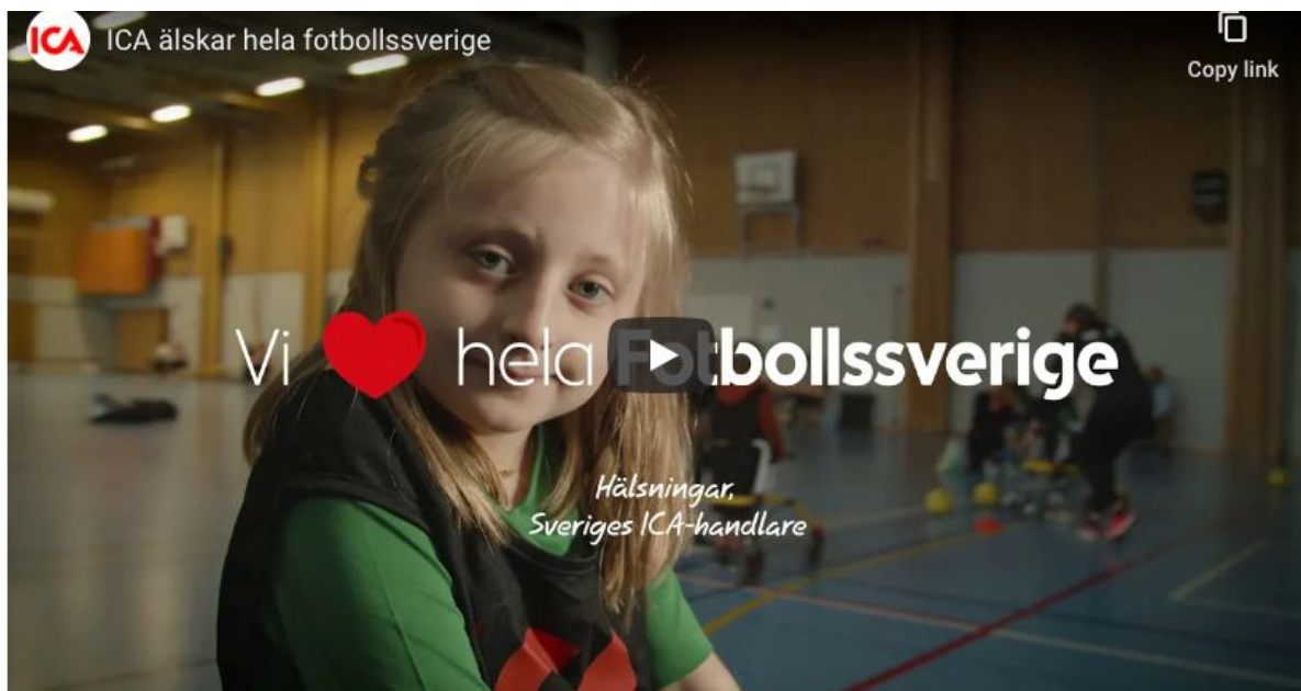
Bild: Stockholm Frame Fotboll är ett av lagen som är med i ICA:s filmer för fotbollssverige.