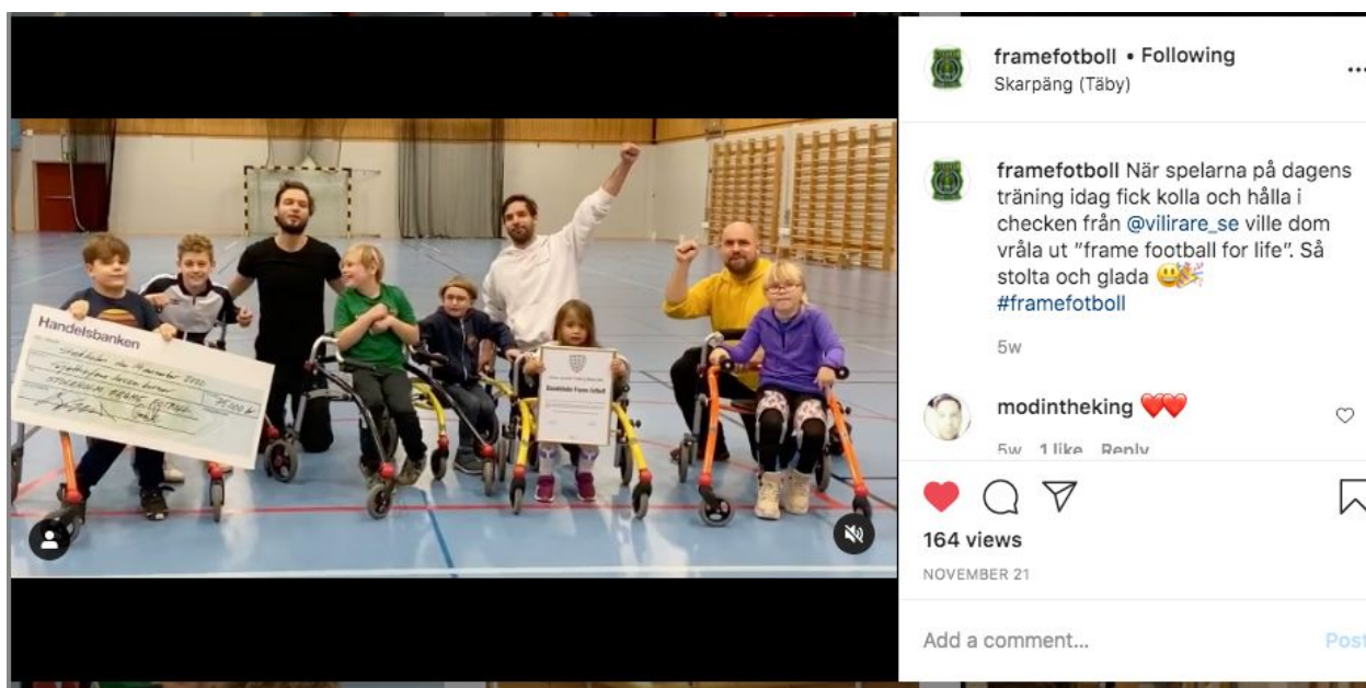
Bild: Jubel på träningen när spelarna fick känna på segerchecken och det fina diplommet. Hela filmklippet finns på vårt Instagramkonto.

https://sverigesradio.se/avsnitt/1602468?fbclid=IwAR0mSqyND2-543sg25OCkAVs_slQB37PgDAZHxcTJRceGdjWzrmsvq-PT1U