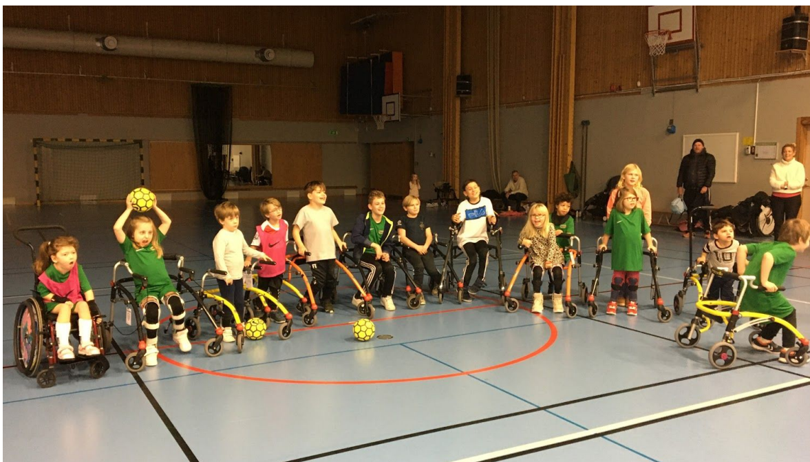
Bild: Bra drag på träningarna under hösten.

Under hösten har vi, trots pågående pandemi, kunnat erbjuda regelbundna träningar. Men med följande restriktioner: