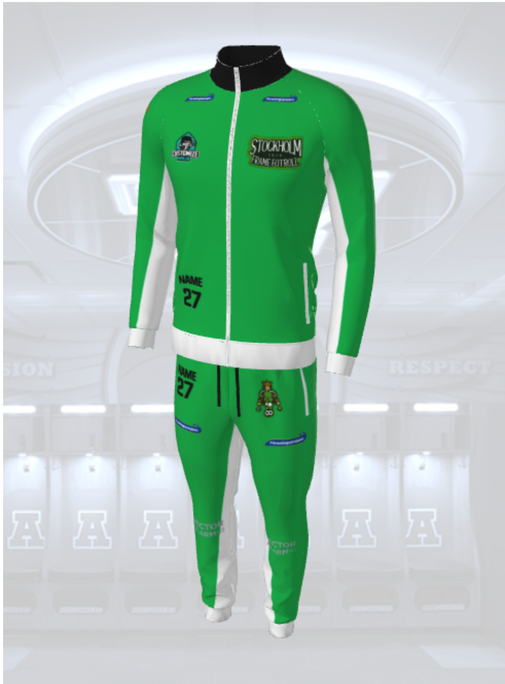
Bild: Skiss på den nya overallen

Priset är 249 kronor styck och faktureras i samband med höstens träningsavgift. Det finns ett fåtal sponsorplatser kvar på den nya overallen. Är det någon som känner till någon som skulle vilja vara med på nya overallen - tveka inte att tipsa på framefotboll@gmail.com . Tack!