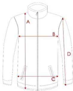
YOUTH SWEATSHIRT / ZIPPER / HOODIE