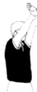
11b. Passivt spel

Att hålla bollen inom det egna laget utan att någon anfallshandling är synbar eller inget försök görs att komma till målskott. Domarna bör markera genom ett varningstecken. Om laget trots detta inte försöker nå ett avslut mot mål (inom 5 sekunder) skall det försvarande laget erhålla ett frikast.