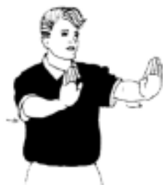
10. Håll 3 meters avstånd