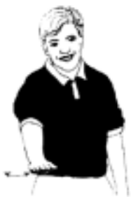
1. Beträdande av målgården

- Man får använda allt från knät och uppåt för att kasta, stöta, stoppa och fånga bollen.