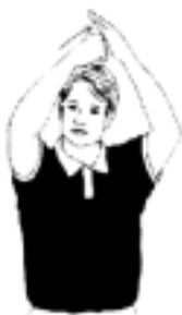
6. Tacklingsfel (stürmerfoul) dvs knuffa, springa på, hoppa på