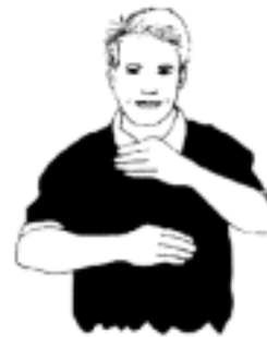
3. För många steg. Bollen hålls mer än 3 sekunder

- En utspelare får ej passa in bollen till egen målvakt som befinner sig i målgården (frikast).