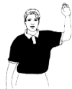
11a. Förvarningstecken "passivt spel"