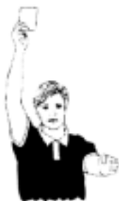
14. Varning (gult kort), diskvalifikation (rött kort)