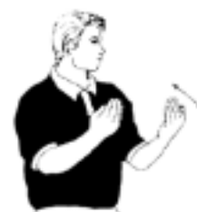
18. Tillåtelse att beträda spelplanen vid time-out

När bollen har passerat sidlinjen får det lag som ej rörde bollen sist inkast. Den som lägger inkastet skall stå med en fot på linjen.