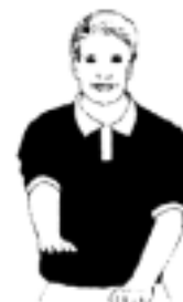
2. Felaktigt fångande av bollen, dribblingsfel