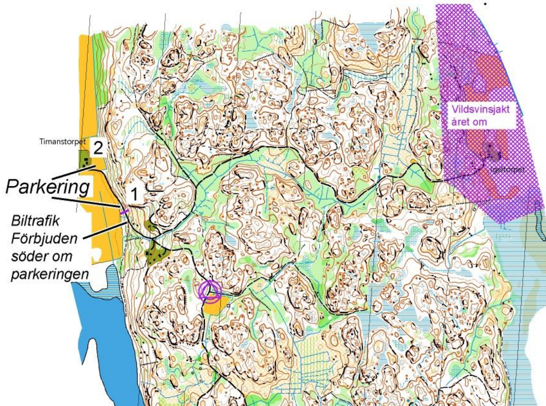
Karta Dyhult. Ritad 2020.