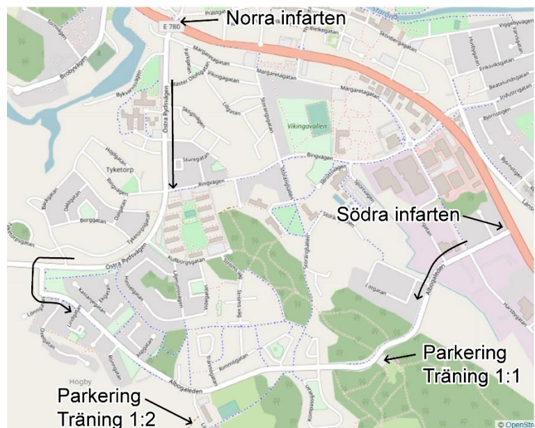
Vägvisning i Söderköping