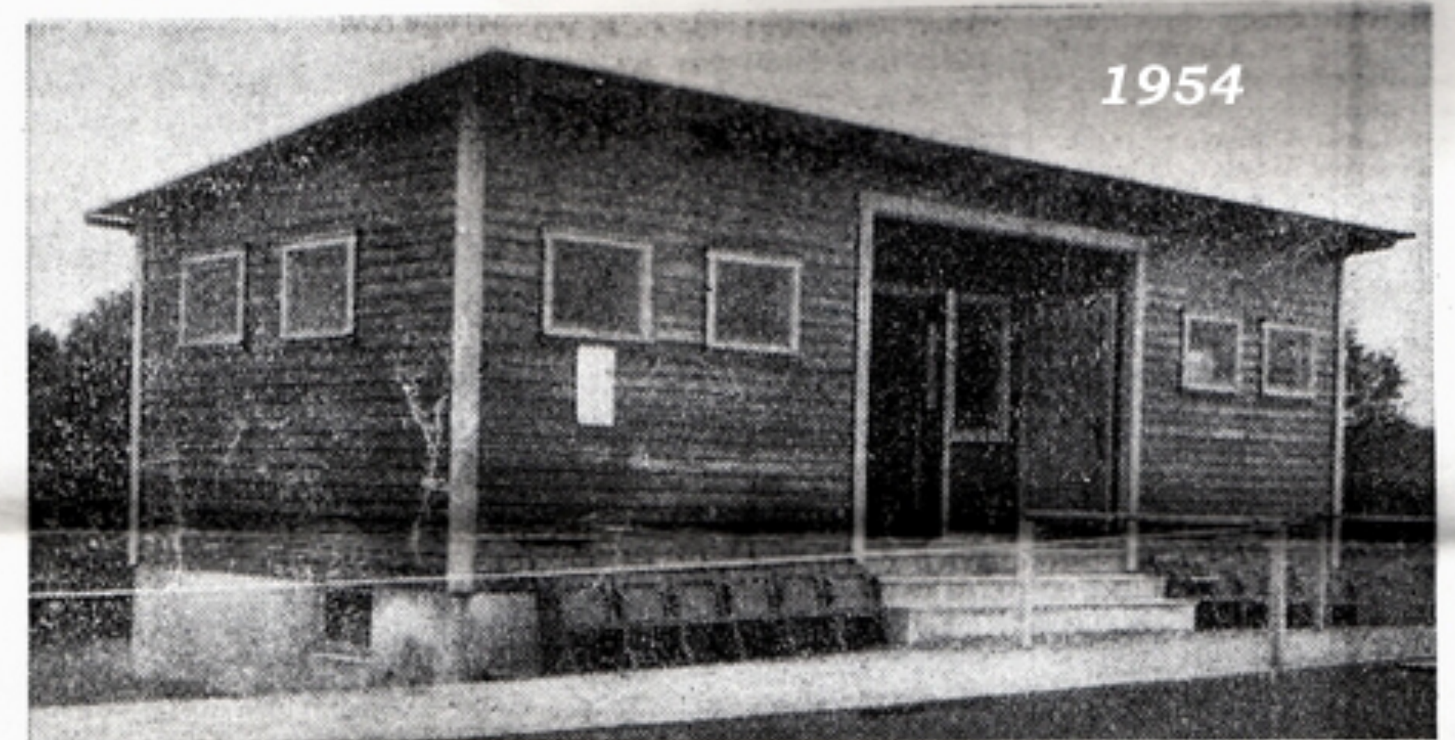
Omklädningspaviljongen — bekostad av kommunen — står färdig sedan i fjol.