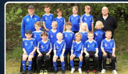
SIGTUNA IF FK - P14