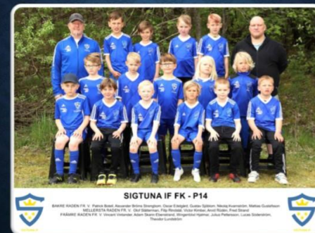
SIGTUNA IF FK - P14