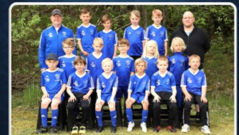
SIGTUNA IF FK - P14